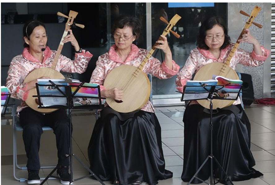
月琴班的成員全心投入，古樸的旋律與輕柔歌聲相互交應，餘音裊裊。