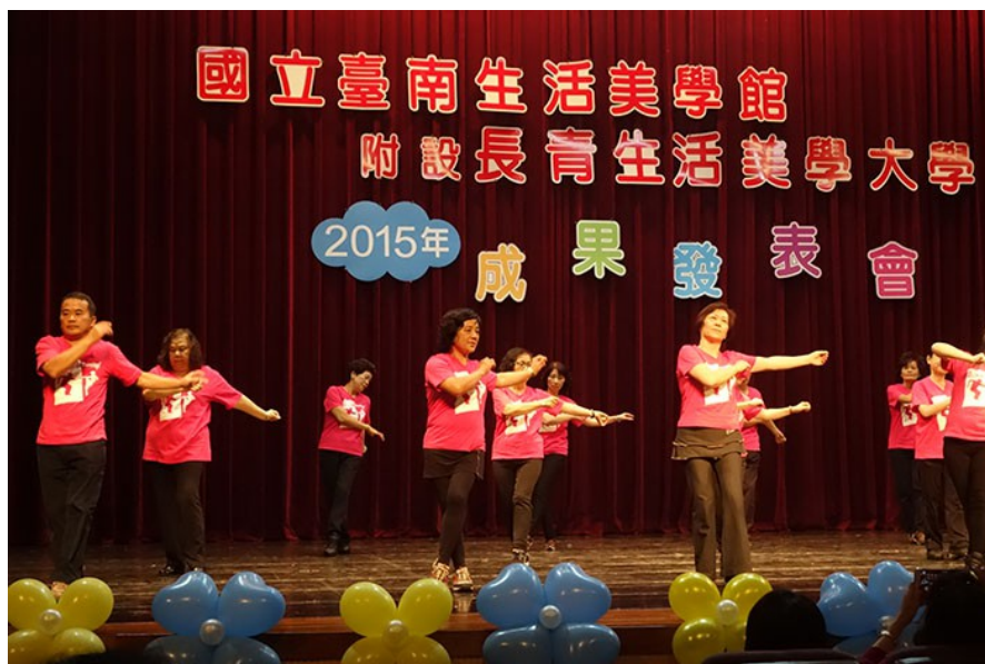
健康運動舞除了讓銀髮族伸展肢體，鍛鍊健康的身体擁抱樂齡生活，整齊劃一的動作更展現長青活力，舞臺下歡呼四起。