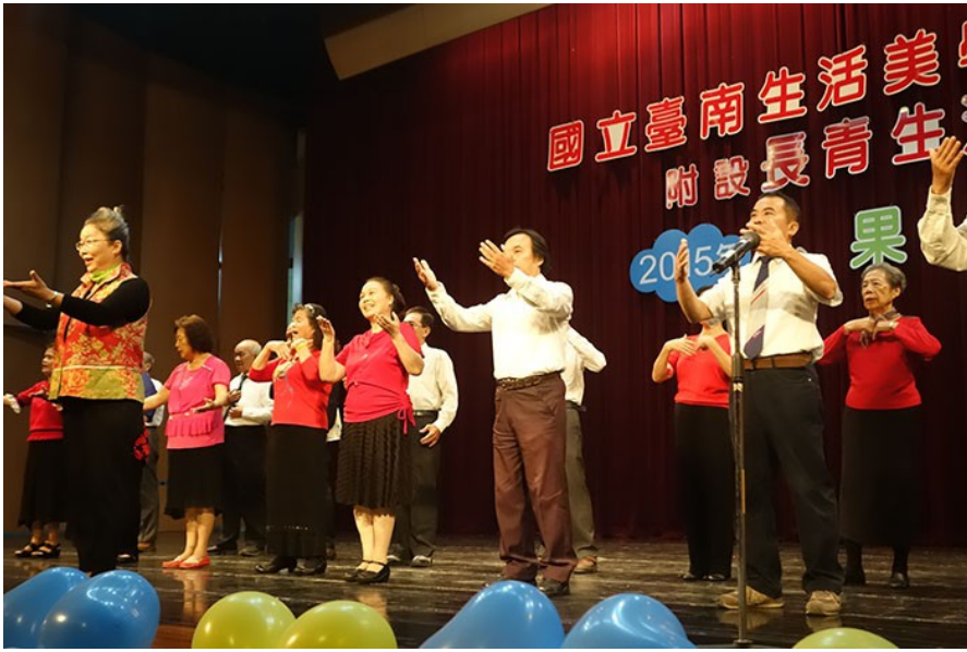
歌唱班以統一的西裝、紅衣黑裙作為表演服，隨著老師的指揮搭配手勢，引吭高歌。