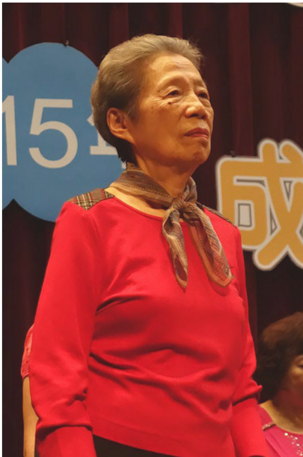
已屆高齡的奶奶仍持續充實自我，參與歌唱班，並透過成果發表會讓大家聽見她的歌聲。