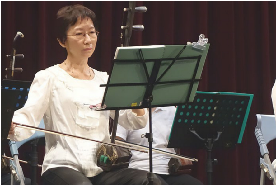
二胡初級班的成員拉奏二胡時專注的神態，帶著觀眾一同進入二胡優美的旋律之中。