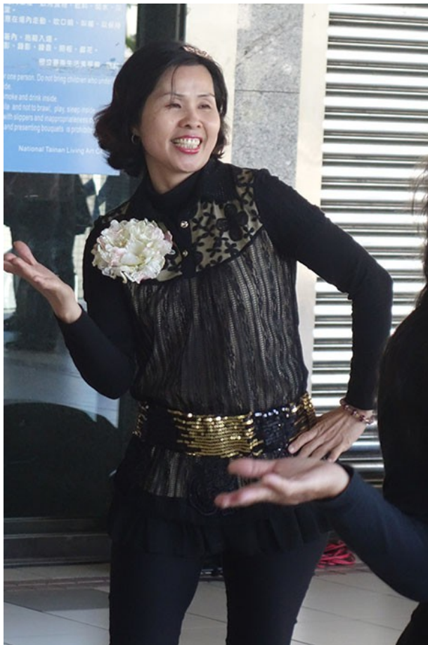
表演者嫻熟地跳著休閒排舞，臉上帶著開心的笑容，對舞蹈的熱情展露無遺。