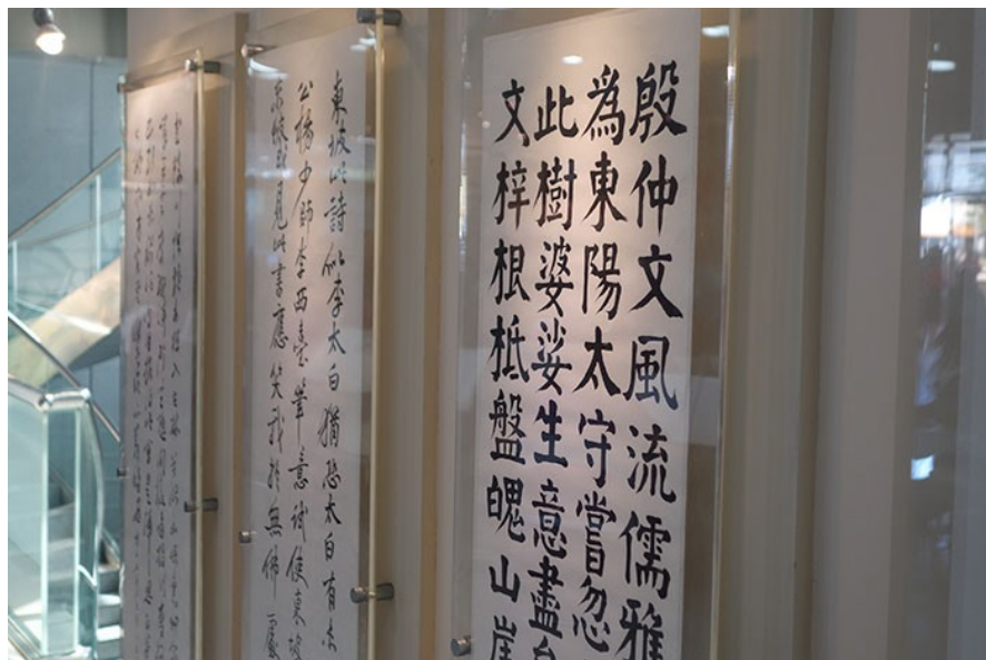
大廳的書法展覽從楷書到草書都有，一筆一劃皆展現深厚功力。