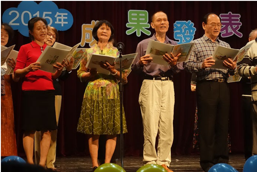
日語會話班以歌唱日文歌的形式展現，透過演唱大家所耳熟能詳的歌曲，勾起當年共同的回憶。