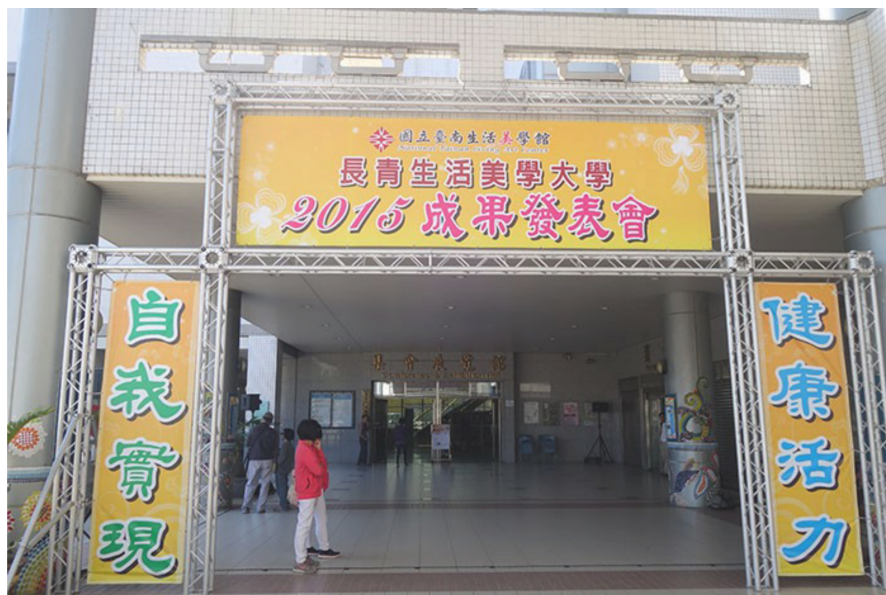
臺南生活美學館的成果發表會，使長青族得以展現樂齡生活的健康活力。

國立臺南生活美學館以推廣生活美學、文化藝術展演等為己任，並附設長青生活美學大學，為五十五歲以上的老年人口舉辦研習課程，並舉辦成果發表會，讓學員一展學習成果，展現長青生活的活力與價值。二〇一五年十二月六日，兩年一次的成果發表會如期舉行，使平日清靜的臺南生活美學館特別熱鬧，當天的展演內容十分多元，包含書法、舞蹈、樂器、唱歌等，給長青族大展身手的機會。