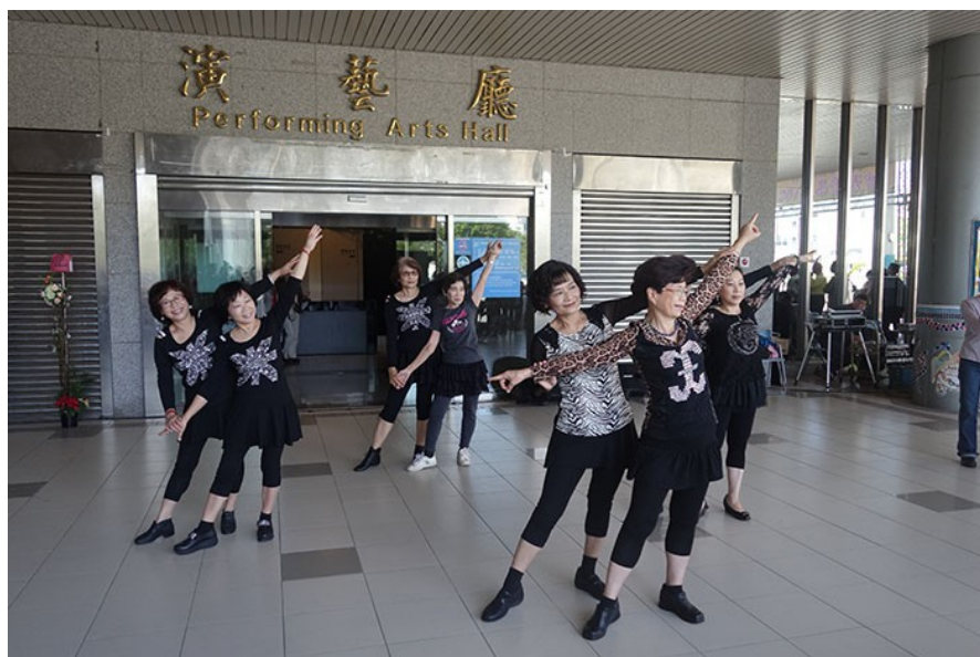
活力美姿曲線健康舞的學員跳著恰恰的舞步，臉上綻放燦爛的笑容。