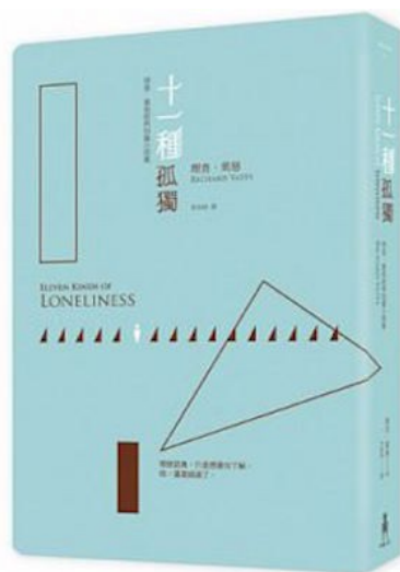
《十一種孤獨》用十一篇故事訴說孤獨。

葉慈的手法雖平鋪直敘，卻不減對人生體悟的著墨。他以對話構築故事，善用留白，將情緒堆疊至最高點時，嘎然而止，徒留讀者揣摩敘事者心理的空間。開放式的結尾，需再三反芻才能理解箇中深意。封底的一句話：「孤獨是，當我們有機會得到他人的了解時，那個瞬間一閃即逝。」道出全書主旨。孤獨可以是喜，也可以是悲，兩者皆使人們從窒息的生活解脫。葉慈用十一個故事，藉角色點醒麻木的讀者，在不斷追求旁人認同的社會裡，眾人早已忘卻自身初衷。唯在孤獨時，能不必遷就於人際關係，與自己的思想獨處，找回自我。