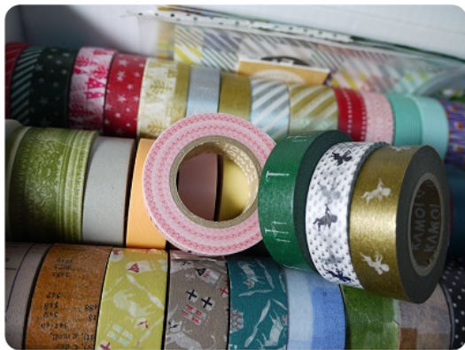
紙膠帶款款花色不同，且並非一般的膠帶。

一卷卷看似普通的膠帶，上頭印著一圈圈不同風格的圖案，有的清新可愛，有的活潑花俏。這些膠帶其實不同於一般的膠帶，它們有個特別的專屬名稱——「紙膠帶」（Masking Tape，可簡稱為MT，又稱和紙膠帶）。