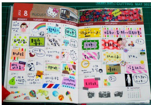
紙膠帶是寫手帳的重要工具，增添繽紛活力，記錄生活的美好。

「手帳」與日記的性質很相似，不過手帳的內容通常比一般人熟知的日記更為精緻、可愛，且較為豐富。在書寫文字時，旁邊會加上很多裝飾，其中很大一部分裝飾會使用到紙膠帶。例如在內頁空白的地方，可以利用紙膠帶填上顏色，邊框也可以用紙膠帶做裝飾；欄目分割的部分貼上紙膠帶，就可以在上頭書寫標題文字；膠帶上的圖案剪下後可以點綴在相關的文字旁邊，也可以利用紙膠帶為自己畫的圖拼貼花色；另外在手帳封面貼上一條條紙膠帶，就可以依照個人喜好拼貼出想要的封面樣式。寫手帳可說是紙膠帶最廣泛使用方式之一，而紙膠帶為手帳增添了許多的美感，吸引了更大量喜愛寫日記的民眾，甚至有些原本沒有寫日記習慣的民眾，也會為了紙膠帶開始製作屬於自己的手帳。