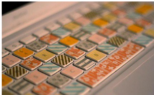
紙膠帶可以用來裝飾生活中的各種物品。

所吸引。紙膠帶用途多元，可以用於一般的包裝、標示重點、卡片的製作，或是生活用品的裝飾等。因為外觀好看且功能實用，紙膠帶也可以是一個送禮的好選擇，甚至有人會純粹為了收藏到各種喜愛的花樣而購買紙膠帶。而除了這些功用外，許多也會將紙膠帶用於「手帳」的書寫上。