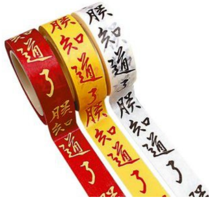
故宮博物院推出三種顏色款式的「朕知道了」紙膠帶，轟動一時。