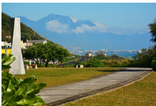
花蓮有許多美麗的風景，每到假日往往吸引許多遊客前來觀光。

花蓮以太魯閣、七星潭等自然景觀聞名，每年吸引許多遊客前來觀光。自從二〇〇八年臺灣正式開放陸客來臺旅遊觀光，陸客為外國來臺觀光總人數之冠，除了大量的大陸旅行團（以下簡稱團客）以外，再加上自由行的旅客，每年陸客來臺人數不斷攀升，根據交通部觀光局統計二〇一四年大陸來臺觀光人數高達339萬人。