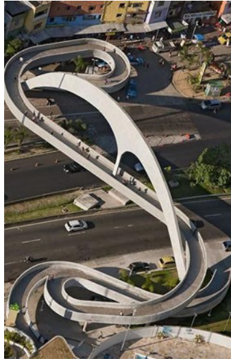
建築師尼邁耶希望透過陸橋，拉近貧富斷層。

為陸橋缺乏實用性，雖是如此，但這個想法卻是劃時代的一大進步。作者提到建築最大的挑戰，其實是建築師如何提供經過設計的房子給平民百姓，目前巴西政府正在推動改良住宅，以及加強貧民窟的治安，期望能將陸橋的兩端化為平等，彌平社會的貧富差距。