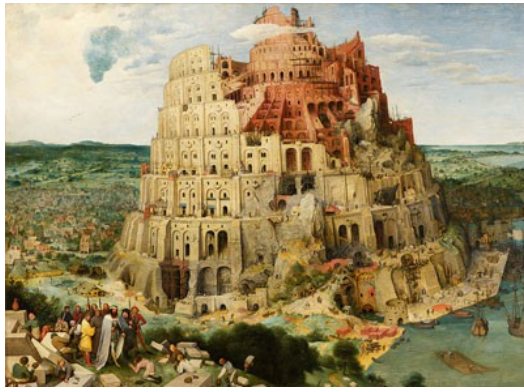
巴別塔為當時人類所興建，想蓋一座延伸到天際的高塔，傳達自己姓名。