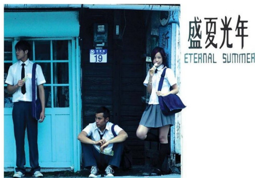
【盛夏光年】便是常見的青春三角戀。

夠有著不同於普通愛情劇的元素，因此比較容易又快速的方法是出現一位喜歡同性別的人。同志，這個在電影中多半帶有文青色彩，又不會太難使用的元素，便被一再重複使用。