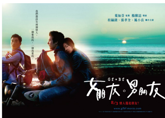
【女朋友。男朋友】用大時代的包裝，讓常見的三角戀不再老套。

【女朋友。男朋友】雖然一樣是兩男一女的三角戀，但是加入了解嚴的大時代作為背景，從青春無敵的校園一路成長到未來，讓男女主角的愛纏繞上時代的變動，而有了身不由己的效果，愛情變的無奈、但是無奈中也有著幸福存在。【海角七號】中除了有貼近你我生活的辦桌、野台開唱等等，更加入了多元的愛情面貌。主角阿嘉和友子的異國相戀、水蛙愛上老闆娘的年齡與禁忌之戀、或是二戰時期的日本老師和女學生跨越時代的戀情。愛情不只有單一面貌的，但是只要加點巧思，都能夠讓觀眾感到新意，與著實的感動。