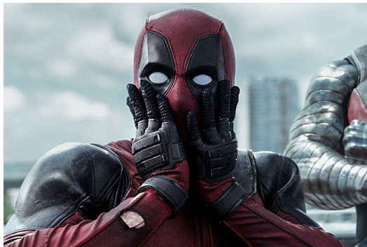
過年賀歲票房的【死侍】事件引起軒然大波。

但是，近幾年來的國片市場實屬荒涼。自【海角七號】好不容易以貼近台灣民眾生活、細緻編織的劇情而破億票房以來，多少作品都只是想搭上國片的熱潮，而品質與劇情都參差不齊的作品。台灣的市場小、資金也沒辦法像一般大國的片動輒上億，但是【死侍】事件也告訴我們，台灣人不再以「國片之名」，就進戲院將一部電影捧得破億。