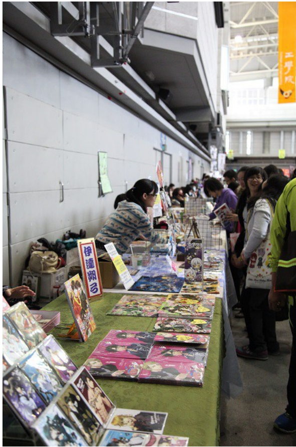
一排排的社團攤位上，擺放著許多同人誌，以及動漫相關擺飾等商品。