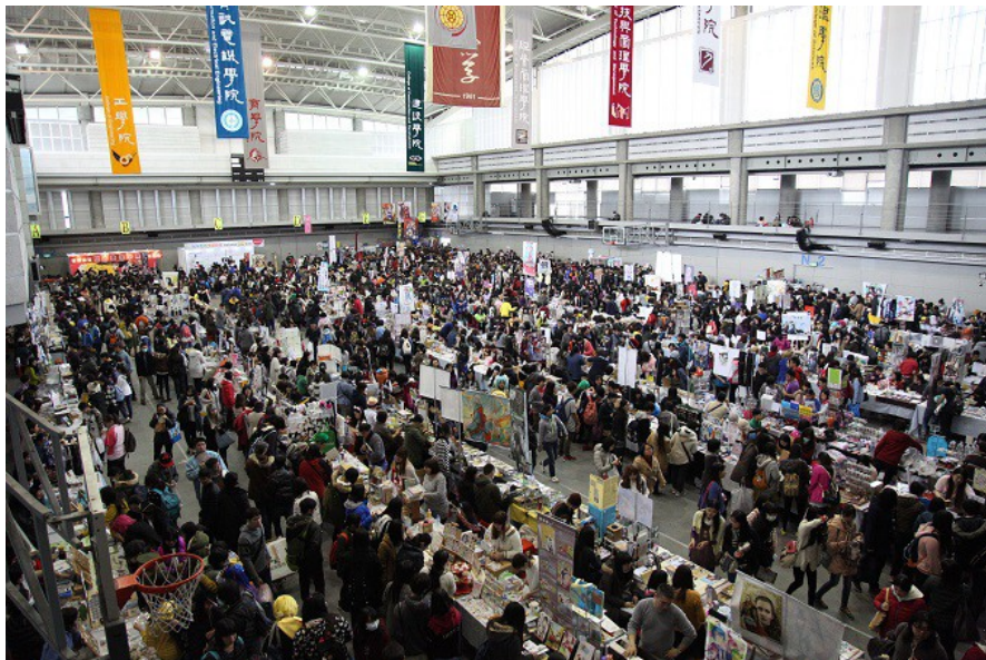
展場內部人山人海，充滿社團攤位及參展人潮，非常熱鬧。

於二〇一六年三月十二、十三日舉辦的CWT T15同人誌活動，不分場內外均熱鬧萬分。場內除了販售同人商品的社團攤位，還有藉由掃描將人臉3D化的創作體驗活動及抽獎遊戲，吸引了大量人潮參觀。場外亦有為數眾多、外型亮眼的Coser在展場附近隨意走動，對Cosplay有興趣的民眾也跟著四處移動，欣賞、拍攝一個個自己喜愛的角色。