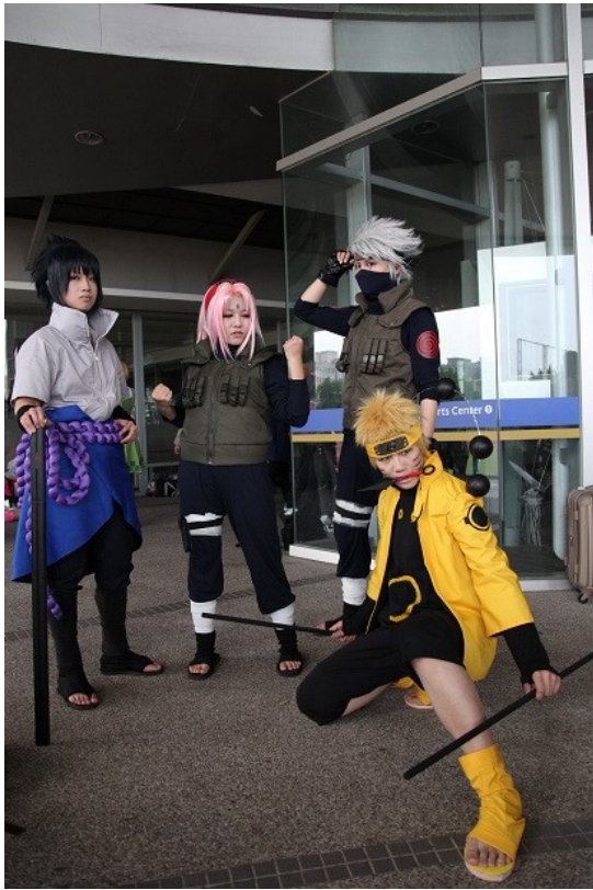
【火影忍者】的主角們擺出帥氣的備戰架勢，隨時準備迎接新的挑戰。