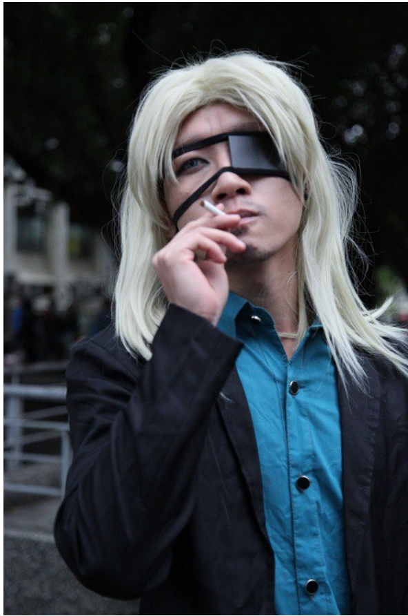
【黑街】的沃力克一如既往地抽著香菸，望著遠方的天空若有所思。