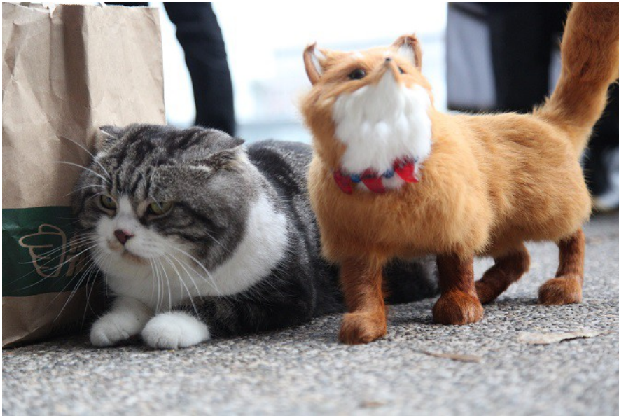
展館旁，乖巧的小貓氣定神閒地看著圍觀群眾，意外成了Cosplay以外的焦點。