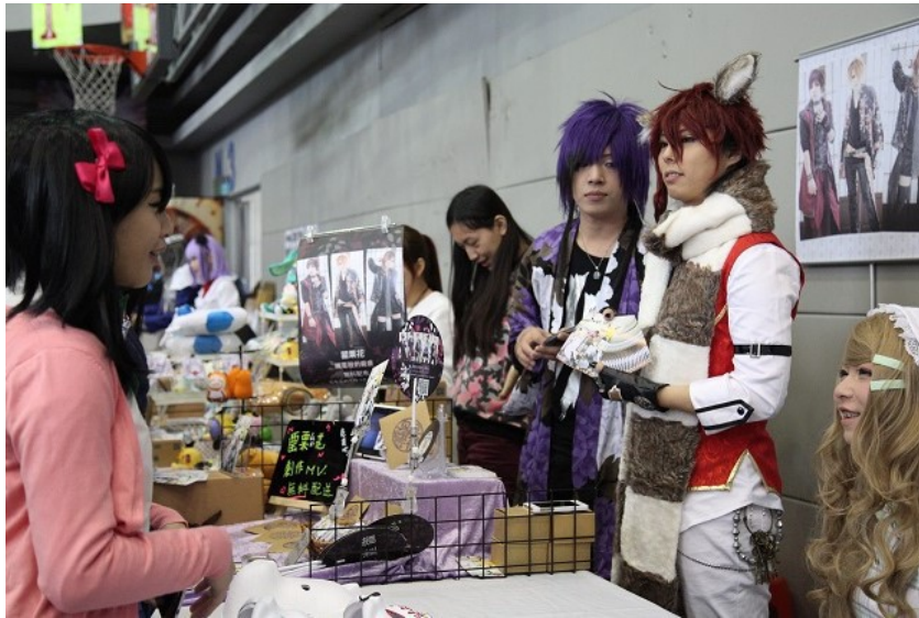
展場中隨處可見精心打扮的民眾，無論是攤商或是逛展的coser，都有可能成為場中的亮點。