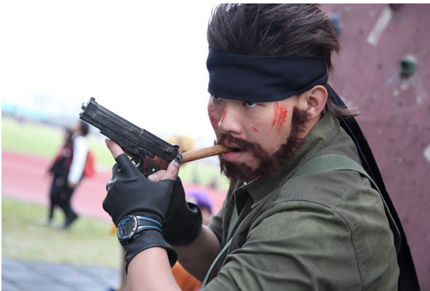
【潛龍諜影】的Snake嘴邊叼著雪茄，似乎正在執行重要任務。