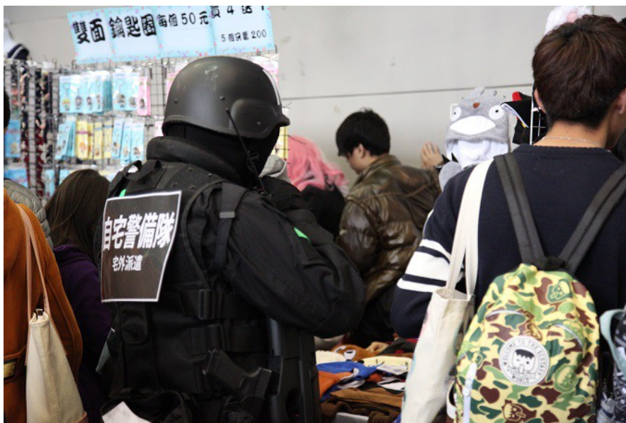
逛展的人群當中也包括許多coser，其中有人扮成了警備隊的模樣，像是在沿著攤位巡邏。