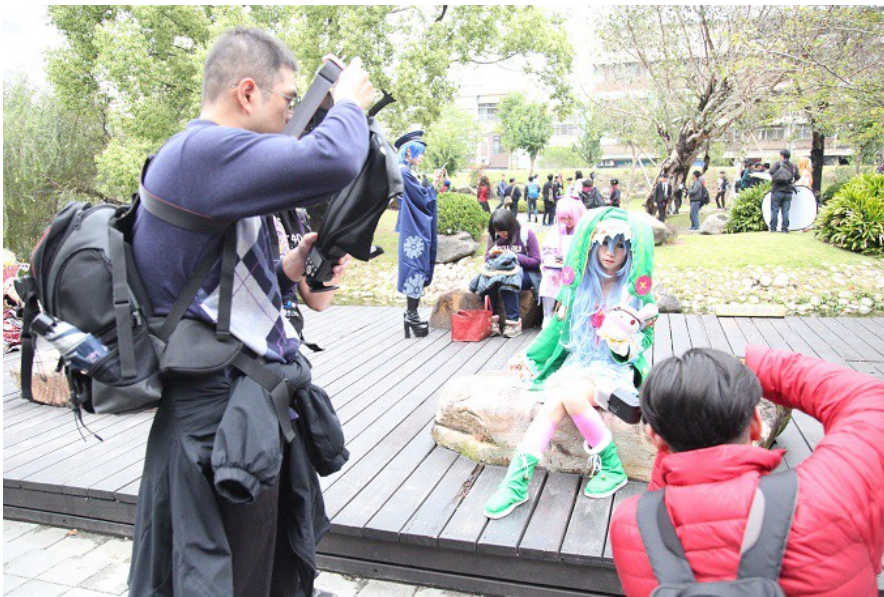
【約會大作戰】的四糸乃坐在展館附近的石子上，面帶疑惑地望著眼前的鏡頭。