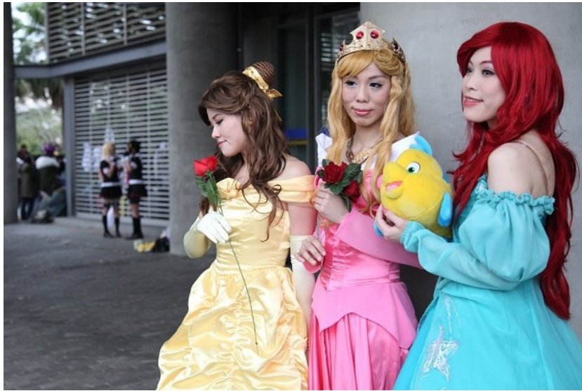
迪士尼公主們自童話中走了出來，悠然自得地享受著午後的時光。