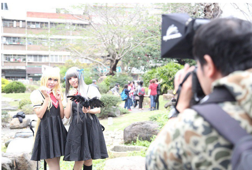
展場附近聚集了許多Coser，以及被Cosplay活動吸引而至的攝影師。