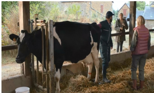
導演將故事發生背景設定為法國傳統農村生活。

【貝禮一家】拍攝地點位於法國西部城市拉瓦勒（Laval），是一個以酪農業為主要生產力的鄉村小城。片中貝禮一家人的生活脫離不了農村，平日寶拉要幫母牛擠奶、餵羊群吃草，半夜與父親一同幫小牛助產，假日則全家到市集販售自家製作的乳酪。導演將傳統法國農村人民的生活模式，透過貝禮一家完整傳達。為了更加符合鄉村生活的閒適，整部片的拍攝步調較為緩慢，也多以暖色系、夕陽餘暉的秋季色澤去營造整部片的氣氛。