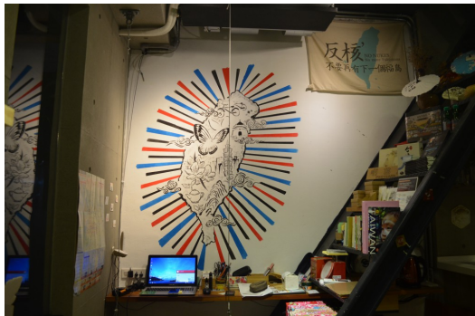
台灣的歷史文化是這間青年旅館的主題。

傳統菜市場旁的巷弄間，一家以臺灣歷史為主題的青年旅館隱身其中，外牆以青天、白日、滿地紅為設計，而內部的擺設裝飾則與台灣的地形、人文相關，全都是圍繞著1949年國民政府來臺後的歷史文化作為發想主題。而這一切，是出自一群想要保存台灣文化的青年創業團隊「厝味文化」之手。