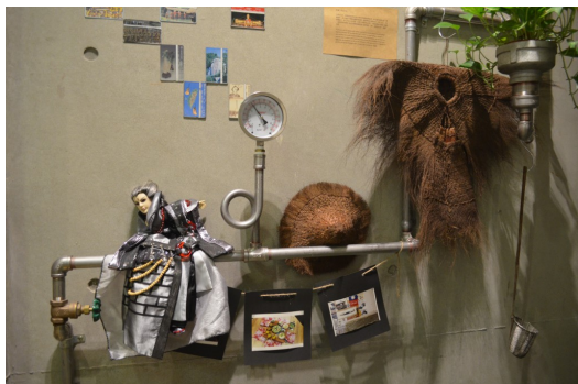
蓑衣、布袋戲偶等等都是能在旅館內看到的裝潢。(照片來源/鄭宇茹攝)

台灣有許多特有的文化、工藝，因為工業化時代的關係而遭逢瀕臨消失的問題，卻也很少人重視這塊，但如果只是被保存在博物館內，埋沒它的文化價值，自然不會被大眾所記得。因此他們認為若能將這些文化與各式各樣的商業形式做結合，讓商業形式擁有一部份的文化意義，不但更具有特色，這些文化也能夠再一次被保存下來。於是，他們想到旅客一天花最多時間的就是在旅館內，如果能讓客人待在旅館的這段時間內就能認識台灣的文化，何嘗不是件一舉兩得的事情。