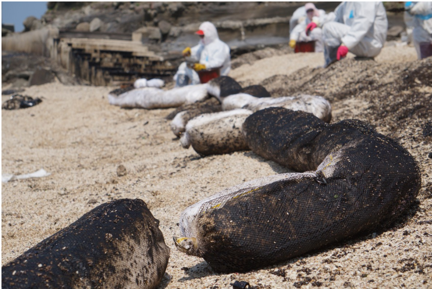
避免沙礫再受污染，將綿紗放至於海灘上吸附油汙。