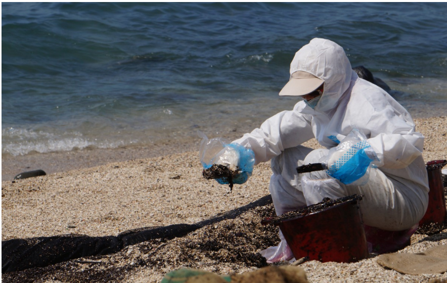
居住於石門洞附近的居民主動來到沙灘挖除被污染的沙子。