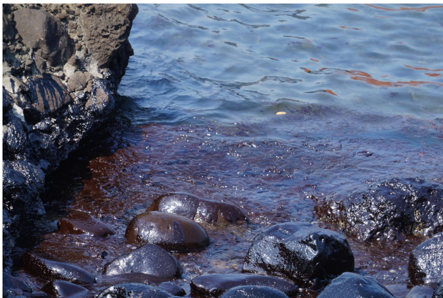
擱淺多時的貨輪因未及時處理，造成油污外漏。

二〇一六年三月十日臺籍貨輪「德翔臺北」因機械故障、船艙進水等問題，擱淺於新北市石門外海。船隻在救援的過程歷經了天象不佳、人員傷亡，搶救行動十分艱難，最終仍是無法避免漏油的情況發生。