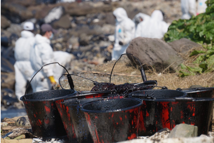
除了挖除受污染的沙礫，以水桶撈除油汙也是救災的辦法之一。