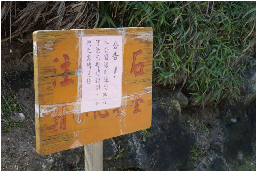
鄰近的石門洞也因為沙灘遭受汙染而暫時不開放觀光。