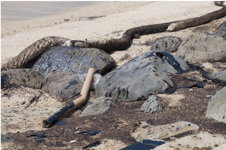
沙灘不再如往常潔白，而是油汙所造成的髒亂不堪。