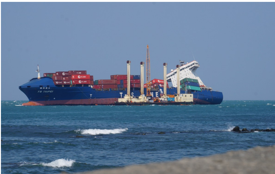
既使最後出動大型機具加速除汙進度，海洋污染也已成事實，因此後續的檢討是當前最重要的事， 避免類似事情再次發生。