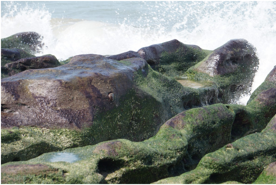
油汙外漏後，北海岸著名景點——老梅綠石槽也難逃一劫，海藻不再如往常鮮綠。