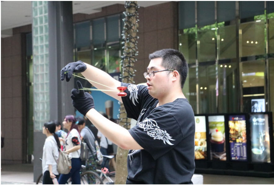
專注展現自身絕技的街頭藝人。