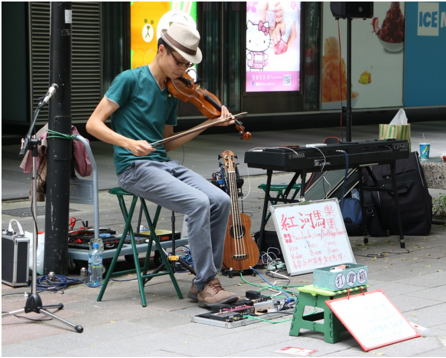
街頭藝人的表演不僅是以個人名義，有時會同時宣傳自身表演團隊。