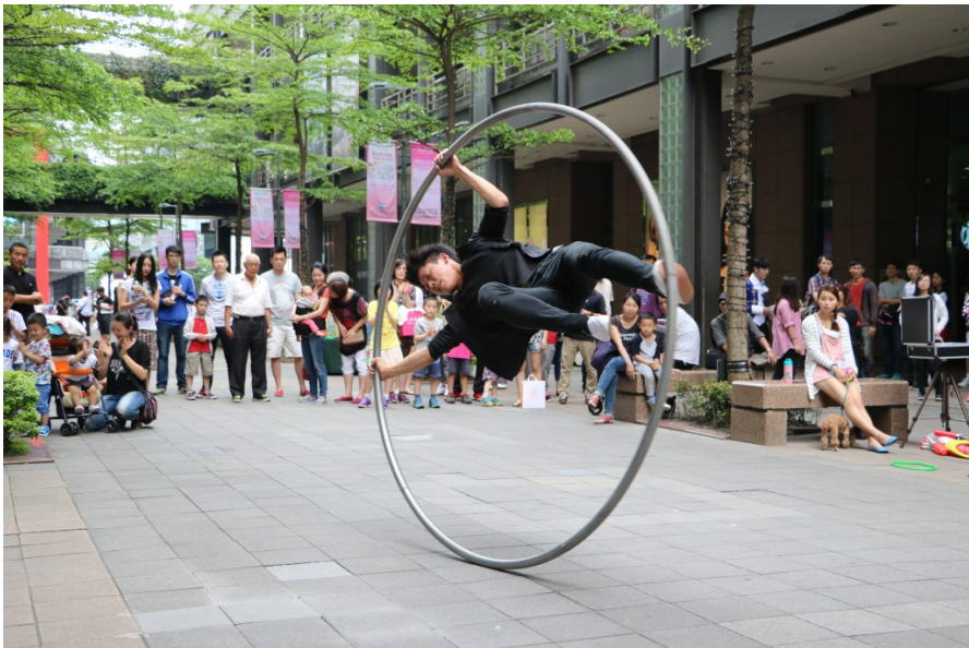
鐵環體操表演，由於項目特殊且精彩絕倫，吸引到大量遊客駐足觀看。