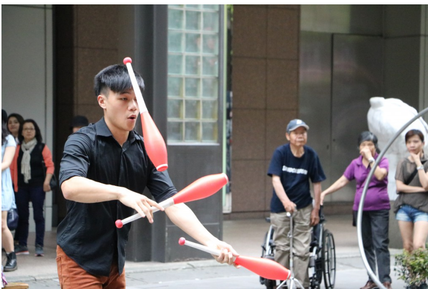
技巧純熟的表演者，表演相當順暢始終沒有發生失誤。