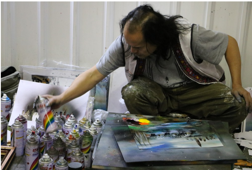
街頭表演項目多元，以噴漆作畫的表演相當吸睛。