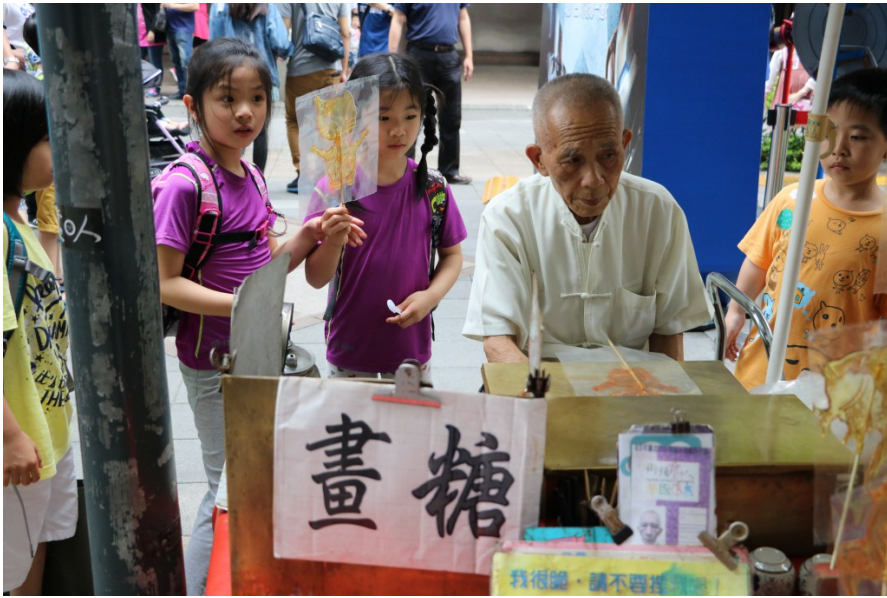
街頭藝人年齡層寬廣，年長的畫糖人以麥芽糖作畫，吸引許多小孩注意。