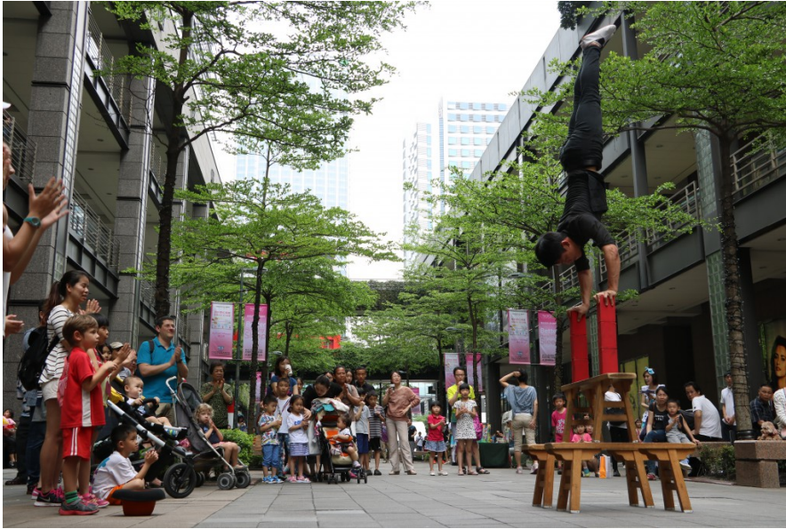
身懷絕技的街頭藝人，在商圈步道中聚集了人潮，知名的街頭藝人甚至可以成為一種「另類景點」。

在政府有計畫的管理下，街頭藝人們聚集在商圈表演，不僅讓這些身懷絕技的人們有地方可以展現，也幫助商業區帶來人潮，同時漸漸地，這些出沒在商圈街的頭藝人，也自成了一個文化圈，成為現代都市生活中新的文化景觀。