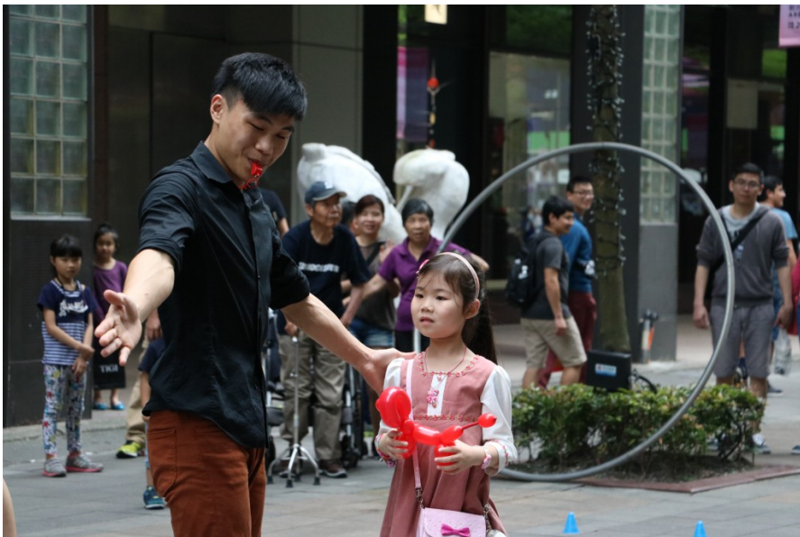
表演者與觀看的遊客互動。