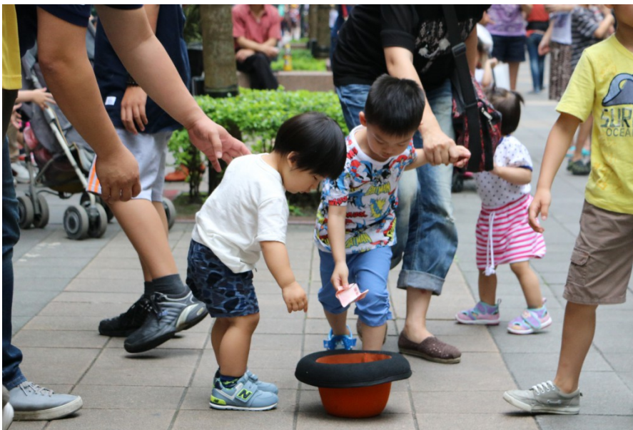
觀眾藉由贊助，給予表演者支持與鼓勵。