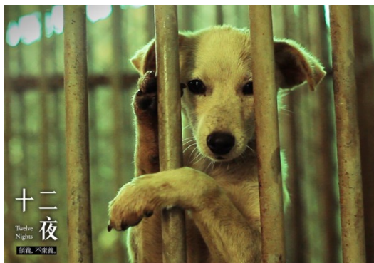
電影十二夜劇照，寫實而又讓人不忍直視。

去呈現，有劇本、有演員和刻意安排的橋段，為的是讓觀眾的心情隨著劇情走向起伏；【十二夜】則是一部紀實的紀錄片，完整地將流浪狗在收容所的無助和恐慌帶給觀眾，對白沒有太多的潤飾，像是一台留聲機，單純地將記錄下來的東西交給觀眾，由閱聽人決定自己接收後的情緒。其實【十二夜】算是一本收容所的觀察日記，透過鏡頭，把收容所中的畫面拍攝出來，其中最要想傳達的寓意，當屬流浪狗遭遇的對待方式，以及經過十二天沒人認養，就得面對安樂死的命運。雖然部份內容有些殘忍，甚至是因為過於寫實，將動物生病滿身是血或爛瘡、因為驚慌而屎尿齊流的畫面完整呈現，讓很多想逃避收容所真相的民眾，了解到遭棄養的寵物所會面臨的下場。這或許不是一部適合輕鬆欣賞的電影，卻是不得不打開的潘朵拉寶盒。