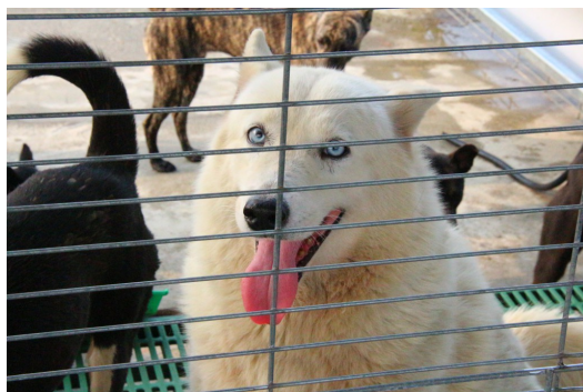
為了讓毛小孩在中途之家能夠享有家的溫暖，需要更多守護的力量。

雖然都能夠端正人心，但感動和當頭棒喝的衝擊，很難去比較哪部片帶給觀眾的正面力量較為積極。有些人可能會因為【狗狗旅館】太過溫馨有趣，而忘記去省思背後所傳達的意思；又或者因為【十二夜】過於沉重，許多人不敢去觀賞而放棄了知的權利。由於【十二夜】是由台灣本土作家九把刀所執導，在台灣的影响力相較於【狗狗旅館】來的高，許多公眾人物也自發性的作宣傳，而藝人隋棠獻音的前導片，讓許多隋棠的粉絲因而對這部片有興趣。加上近幾年流浪動物照護意識的抬頭，雖然不是主流電影的題材和格式，卻在當時創下了首週末全台1300萬的票房，寫下新紀錄。隨著電影留給觀眾的效應逐漸增長，這份感動從文化現象延燒到社會議題的層面上。