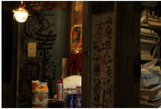
先行一車內部有許多神秘的符號與塗鴉。