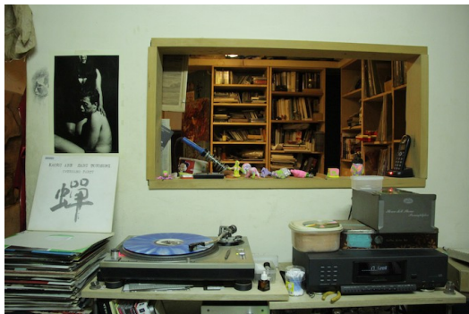
店裡牆上貼著黑狼黃大旺(左)的海報。

除了友川以外，另一位經常造訪先行一車的朋友，是知名音樂人黑狼黃大旺。近來他有個為人所知的身份，就是電音團體勸世宗親會的「勸世阿伯」；事實上，他也是友川的摯友、王啟光在噪音音樂圈的同好。三個人因為互相欣賞對方的才華以及對於音樂的喜愛而聚在一起，而先行一車在其中所扮演的角色，就是音樂同好的交流平台，同時也是一個聯絡感情的地方。