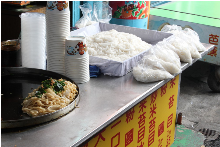
逛累了，就走進一間店大快朵頤一番，享受在地的古早味。