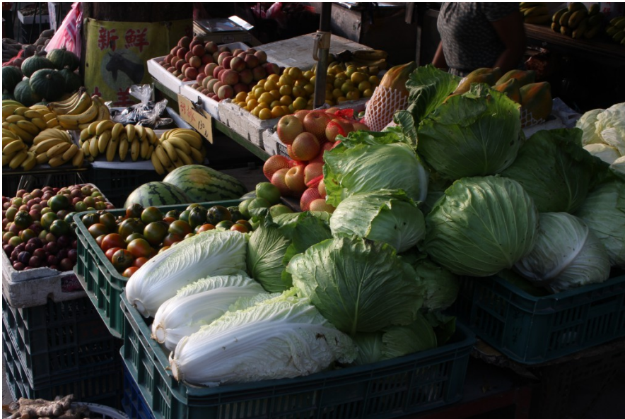
蔬果的新鮮，一看就知道；新鮮的蔬果，才能讓人吃的安心。