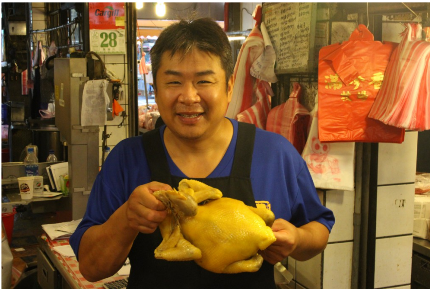
親切的笑容，美味的食物，竹東市場帶給人們一天的活力。