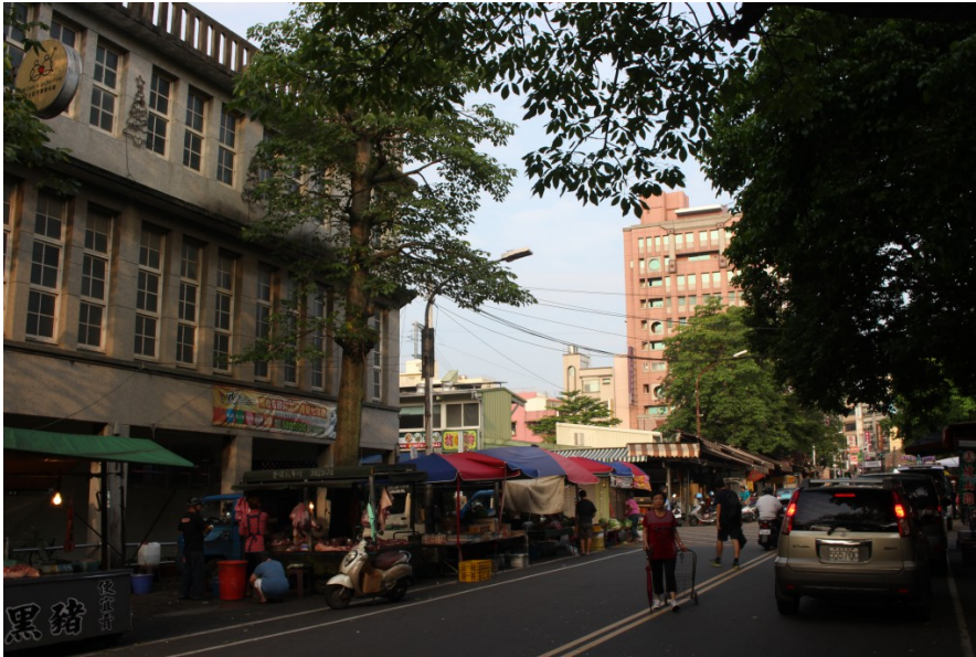
天剛亮，市場旁已人來人往，為新的一天拉開序幕。

竹東鎮中央市場在在地人的心中，是不可或缺的生活重心，也吸引外地人前來一探究竟。小小市場裡，滿載著店家的真心誠意，正適合在這為五臟廟補足生活的元氣。