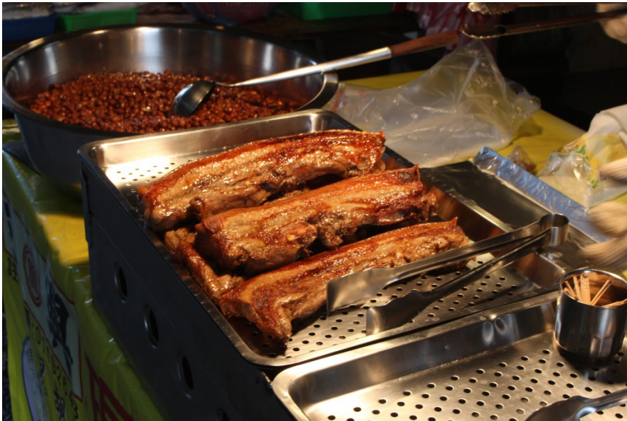
攤販將一塊塊剛出爐的鹹豬肉擺上，肥美的油光與濃郁的香氣，挑逗著顧客的視覺與味覺。