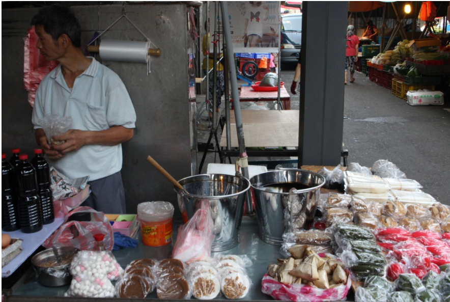
在完成攤子的擺設之後，攤販才得以忙裡偷閒，吃著當天的第一餐。