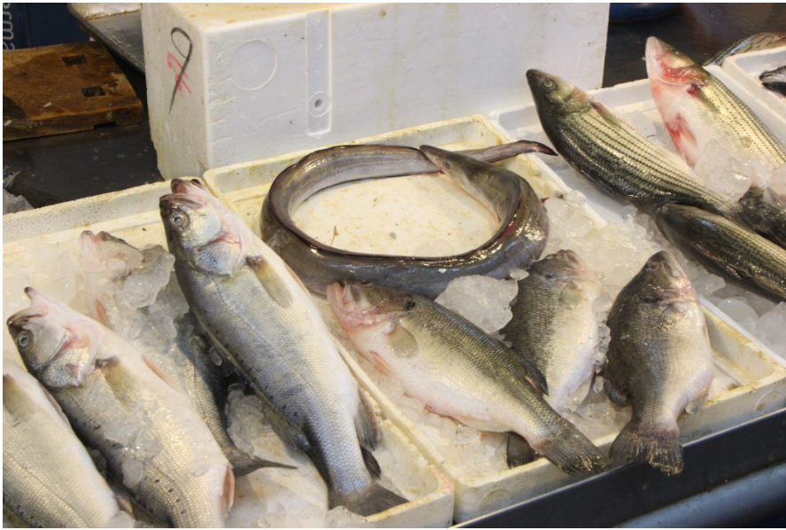
泛黃的保麗龍見證了每一個日出日落，每天都有新鮮漁獲任君挑選。