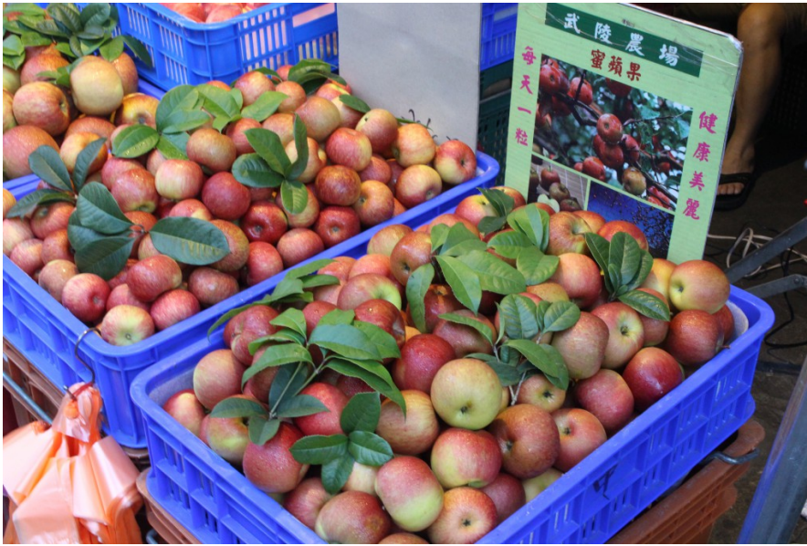
在微微的晨曦下，蘋果閃耀著光澤。