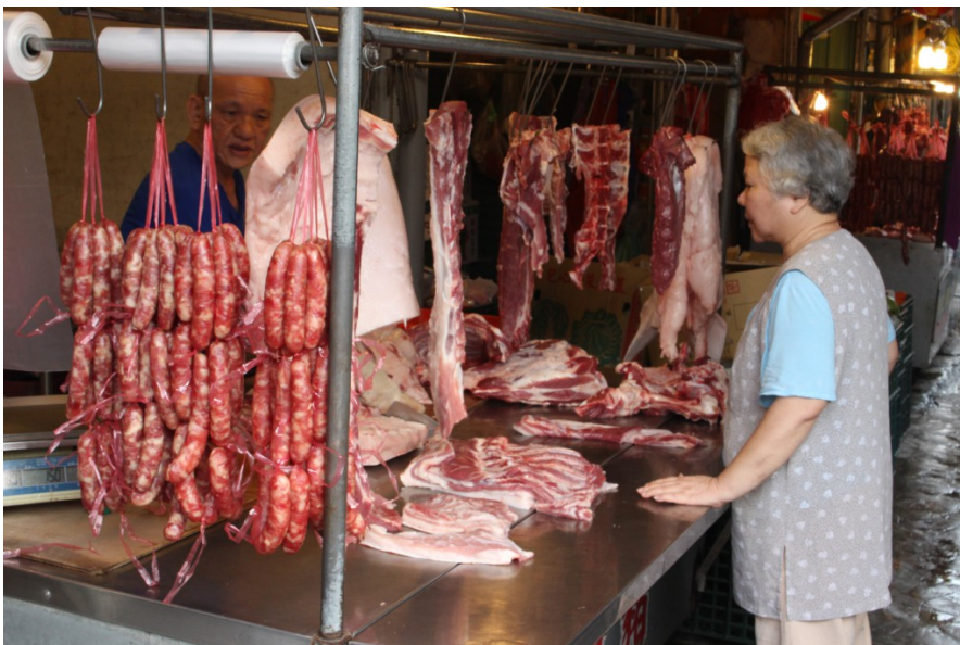
攤販與老顧客間的閒話家常，是數十年如一日的風景。