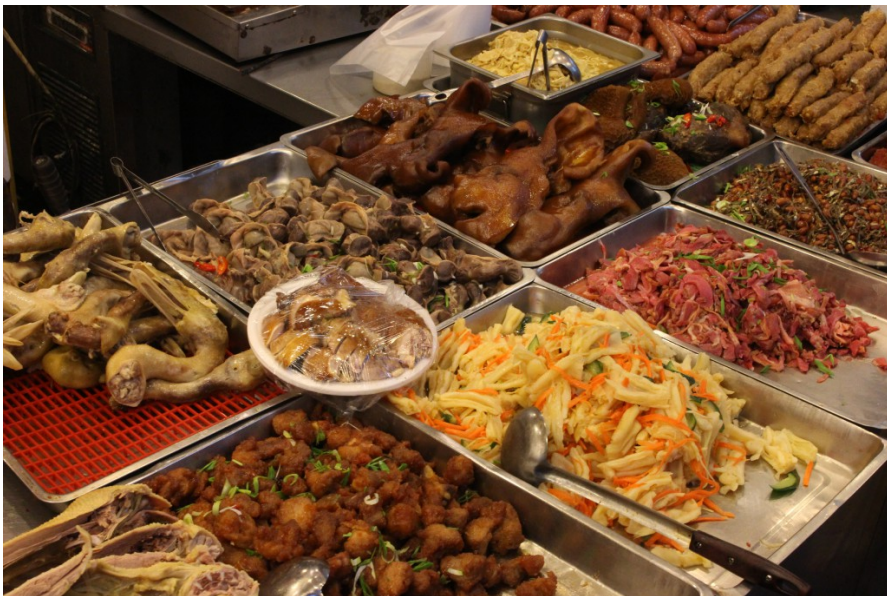
一道道熟食，是傳統市場裡的好味道，也是主婦（夫）張羅飯菜的好幫手。