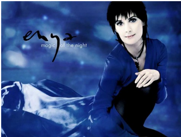
「enya」浮水印首見於恩雅的第一張專輯「Watermark」。

2015年11月，睽違7年，愛爾蘭新世紀樂派（New-Age）樂手恩雅（Enya）推出全新大碟「Dark Sky Island」（暗天之島）。這7年的沉潛恩雅旅居法國，將自己與日月星辰的對話和觀察大自然的感受譜成音樂。