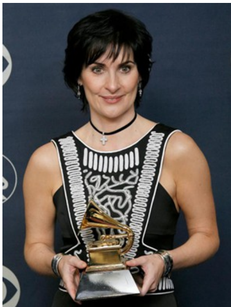
恩雅獲得葛萊美獎「最佳新世紀專輯」。

「Watermark」發行之後過了三年，恩雅完成第二張創作專輯「Shepherd Moons」(牧羊人之月)。它漂亮地在葛萊美獎中奪下「最佳新世紀音樂專輯」，讓恩雅一戰成名。其後接連而來的另外3座葛萊美獎和其他大小獎項，奠定了恩雅在新世紀音樂圈的領導地位。諷刺的是，恩雅本身並不喜歡自己的作品被冠上「最佳新世紀音樂專輯」的頭銜。事實上，許多屬於新世紀音樂這個「類別」(genre)的樂手，都曾發表過言論，「澄清」自己的音樂不屬於「新世紀」，他們不願被貼上「新世紀」的標籤。