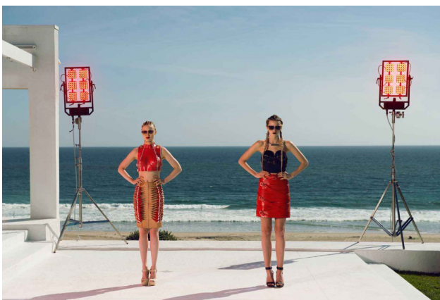
模特兒亮麗的外表下，藏著無數不為人知的秘密。

霓虹（Neon）在電影中是伸展台上照耀著模特兒的燈光，也象徵著每個模特兒競相爭奪「美」的最高榮耀。霓虹美得令人目眩神迷，卻也讓人容易迷失在無止盡的慾望當中，最後只能被更多貪念驅使著一步步踩著他人向上爬。電影「霓虹惡魔」中的模特兒圈好似一個弱肉強食的食物鏈，年輕貌美、條件更好的人選一批一批不斷更新，失去新鮮感的老模特兒只能無情地被淘汰。為了維護工作，甚至是更高的價值一對自身「美」的被肯定、被認同，許多模特兒不擇手段的作為屢見不鮮，最後成為真正的惡魔（Demon）。