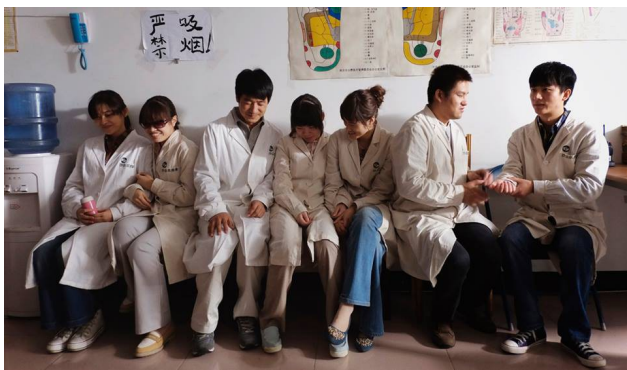
盲人少了視覺的輔助，與他人交流須依靠其他感官。

在盲人的世界裡，一切健全人看得到的，他們必須用聽的。電影裡的聲音及音效很多、很雜、很吵、很大聲，雖然觀眾無從得知是否影片中的聲音呈現為盲人每日聽見的，但可以知道的是，哭泣、接吻、吃東西所發出的聲音，皆是盲人判斷對方動作的依據，其中報時器的聲音，是其他以盲人為題材的電影中鮮少出現的細節。