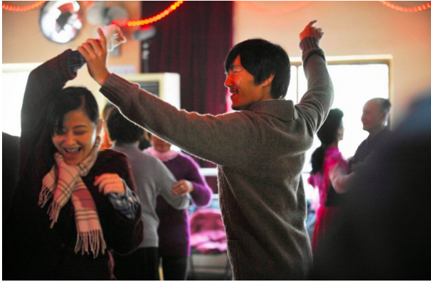
「推拿」對盲人的愛情世界有許多描繪。