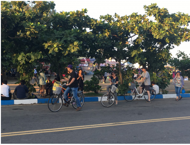
騎腳踏車抓寶。

晚上的公園不再冷清，許多年輕人人手一機，一邊抓寶一邊散步；平常在公園運動的老人也帶著孫子加入抓寶行列。不只是住宅區附近的公園，許多玩家為了抓到稀有怪，會特地到生活圈以外的知名景點「朝聖」，每到假日，北投和南寮總是充滿人潮，有抓寶就要到「北北投，南南寮」的說法，大批民眾的湧入對於當地居民與警力造成不小的負擔。