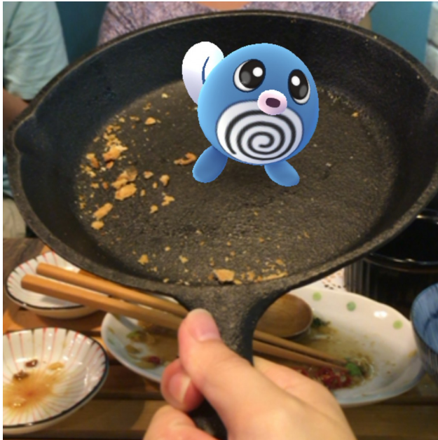
結合AR技術, 玩家可拍照留念。

精靈寶可夢GO (Pokémon GO, 以下簡稱寶可夢) 是一款結合行動裝置與擴增實境 (Augmented Reality, AR) 的遊戲, 玩家利用地理定位, 在現實生活中移動, 探索地圖, 捕捉神奇寶貝, 也可與其他陣營戰鬥, 爭奪道館。遊戲於今年7月在部分地區的iOS和Android平台上發布, 台灣於8月6號開放下載。