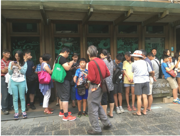
許多家庭一同到北投公園抓寶。

「我今天抓到了卡比獸！」「在哪裡抓到的？晚上帶媽媽去好不好？」因為寶可夢，家庭間的對話不再只有上對下的叮嚀、對課業的關心，還有對遊戲的討論。遊戲改變了親子關係，孩子向父母說明玩遊戲的方法，顛倒家庭內的角色，父母這時不扮演教育者的角色，面對新事物，他們必須向孩子學習；孩子在教學的過程中獲得成就感，親子間產生更多互動，拉近彼此的關係。