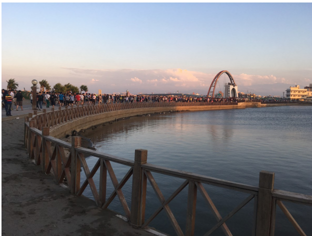
稀有怪出現，南寮上演大遷徙，人潮集中到彩虹橋。

許多家庭因此有了固定的散步時間，全家相約在住家附近或是公園散步運動兼抓寶；有些家長沒玩遊戲，但因為寶可夢讓孩子願意一起出門散步、聊天，增進感情；有些爸媽級玩家比孩子還要投入遊戲，會特地帶小孩到抓寶聖地體驗「大遷徙」。