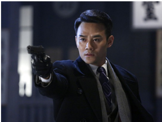
電視劇「偽裝者」劇照。

很多人認為「偽裝者」是消費了「琅琊榜」的觀眾票房才能有不錯的成績，但無庸置疑地，專業的演員就算是對上相似的角色或非典劇本，也能靠維妙維肖的演技表現製造出佳評。