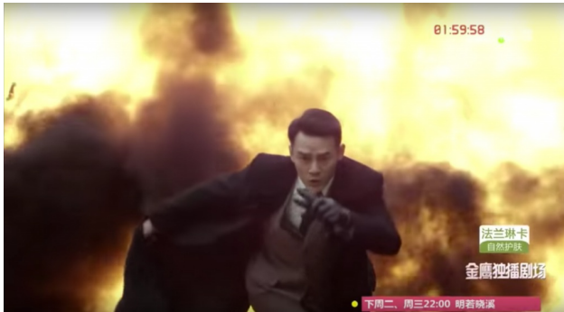
「偽裝者」爆破戲十足。

此外，製作團隊也不惜砸重金呈現逼真的爆破戲碼，還有大排場的戰爭橋段，加上演員的優異外型，皆是現今動作劇情片的賣點。但許多英雄主義情節，使得極富歷史意義的一部電視劇落入歐美英雄主義的窠臼。故事要角如擁有金剛不壞之身，部分故事劇情也過度浮誇、欠缺歷史考究，以致無法讓觀眾深感置身於真史中。