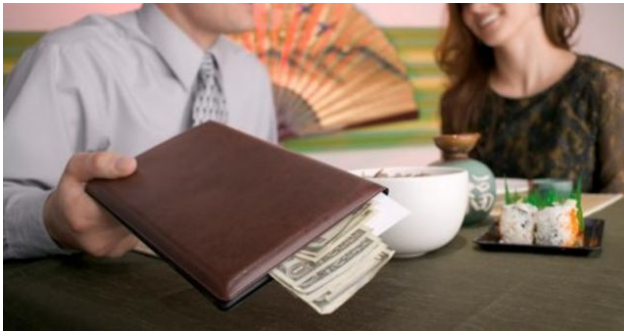
約會時男生被視為要付帳的一方。

從父權紅利和「潛規則」的角度來看，男性也受到制度上的衝擊，例如「不夠大方」、「經濟實力不足」或「不夠陽剛堅強」皆不是社會所期待的男性，換句話說，男性在握有權力的同時，也被賦予加倍的責任和期待。因此在「母豬教徒」眼中，女權主義者是「得了便宜還賣乖」的代表，因為在他們眼中，女性要求消除歧視的同時仍不自知地享受著制度所帶來的部分利益。但回到女權主義的核心思想，父權紅利大抵是建立在女性已被物化後的前提，女性從未真正想獲益，不平等的標準卻一直存在著。