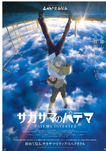
電影海報有兩種版本，此版為帕蒂瑪的重力視角，可見其雙腳騰空。