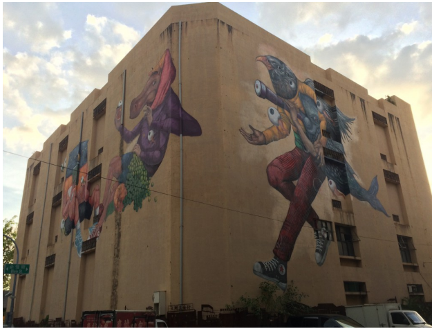
高雄駁二藝術特區旁的大型壁畫，以動物象徵組成高雄的元素。