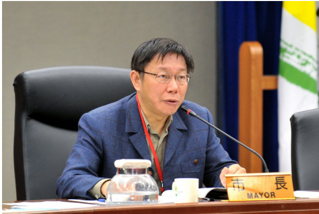
柯文哲的「失言」風波往往造成很大的話題性。

「狂」另一個層面是其執行或表達模式。現代主流新聞媒體(台灣更甚)有「綜藝化」的傾向，也就是不將新聞以傳統的模式呈現，反而輕視內容、重視包裝而使用誇張手法，讓播送內容充斥無深度的花邊新聞。本來能夠以言簡意賅的文字作為新聞標題，反倒用口語、誇飾或煽動性字詞取代，目的仍然是為了吸引閱聽人的注意力。由於台灣地方小而新聞業者眾多，每家業者對同一件新聞事件的描述可能千篇一律、在內容上能吸引閱聽人的程度有限，只好轉而從新聞包裝上著手，也就是試圖從新聞的框架中跳脫。