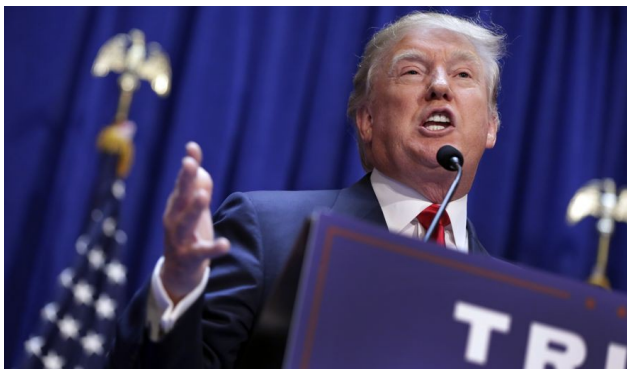
川普的談話風格經常帶給人們堅定而激進的印象。

美國總統大選結果揭曉，共和黨候選人川普（Donald Trump）最終贏得了勝利，此一結果顛覆選前美國許多媒體與評論家的預測。川普自宣布參與競選總統候選提名以來，在貿易、移民、國家安全與宗教等領域的立場表達，經常因其直白用詞產生許多爭議，從而被反對者批評為口無遮攔且想法偏激的「狂人」。在總統大選中與其主要競爭對手希拉蕊（Hillary Clinton）相比，許多人都指出川普顯得較不穩重且缺少政治經驗。儘管如此，川普仍然能夠有效行銷自己、贏得選民的支持，而其重要的行銷關鍵，或許就是他的「狂人」形象。