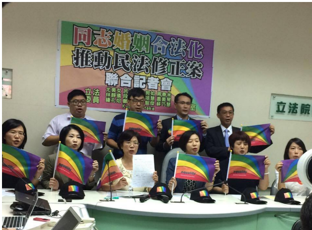
以民進黨立委尤美女為首，推動同志婚姻合法化。

長期投入婦女運動的立委尤美女，於2016年10月24日，聯合民進黨立法院黨團和時代力量、國民黨等38位政黨立委，連署提出《民法》親屬編部分條文修正草案，意圖推動「同志婚姻合法化」。11月八日立法院一審通過，交付程序委員會。希望藉此項法案，讓同志的權益有保障，在未來能享有與異性夫妻相等的權利。