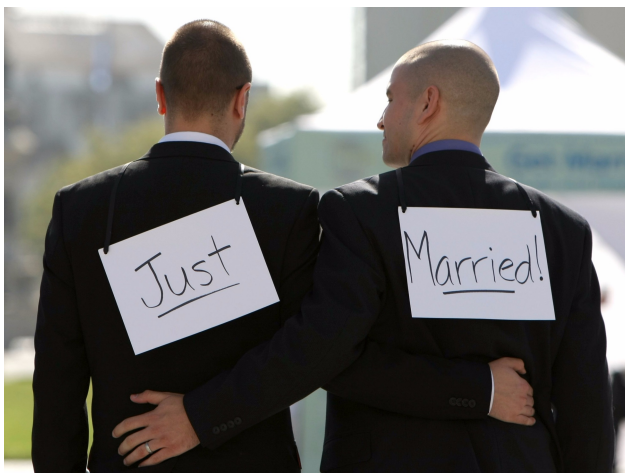
婚姻合法化對於同志伴侶是一種尊重。

同志婚姻法案若通過，如何落實也是一項考驗。政府在法案通過後，必須對民眾進行全面性的宣導，教育方面也應該實施應對方針，對於同志應抱著尊重而非歧視的態度，其餘政府各個部門也都應該配合做法律上的修改，同志婚姻是人權平等的議題，若有立場對立，政府也不應該將此案淪為黨派之爭的炒作新聞。