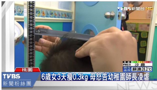
家長遇到問題，訴諸媒體是常選擇的管道。

刺蝟老師不僅惡化親師關係，對孩子也影響甚劇。楊俐容表示：「老師是幼兒在學校的情感依附，倘若沒有安全的依附，會造成孩童漸漸地討厭上學、學習成效不佳。」依附是指幼兒在情感上依賴的對象，倘若孩子和老師的依附關係不良，孩子會不敢接觸外界，無法學習新事物，甚至無法建立良好的人際關係，嚴重者會導致孩童成長過程中行為偏差，甚至更極端地造成反社會人格。