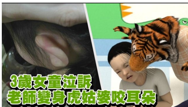
廖父怒控女兒耳朵紅腫是遭體罰

蘋果報導，桃園一所私立幼兒園老師於中秋節活動教學時跟學童開玩笑「今天要烤肉，老師要來吃你們」。不料廖姓女童父親卻因此對老師提告，怒控老師咬女兒的耳朵，害女童不敢上學。而老師則回覆該日為單純教學活動，絕對沒有咬女童耳朵。