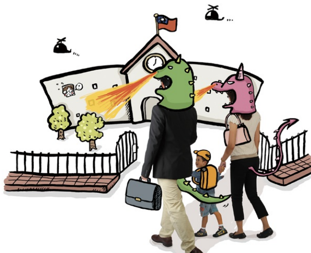
怪獸家長與刺蝟老師的戰爭是現今一急迫且棘手的問題。

參照台灣相關法律，「幼兒教育及照顧法」第39條規定幼兒園之教保服務有損及幼兒權益者，其父母或監護人，得向幼兒園提出異議，不服幼兒園之處理時，得提出申訴。然而現在的家長過度保護孩子，一出問題就要告老師，很多甚至要求依「教師法」第14條第14點解聘教學不力或不能勝任工作有具體事實之教師，使得越來越多老師在教學上感到力不從心，反觀法條中則缺乏對家長的規範，造成親師權利義務不對等。