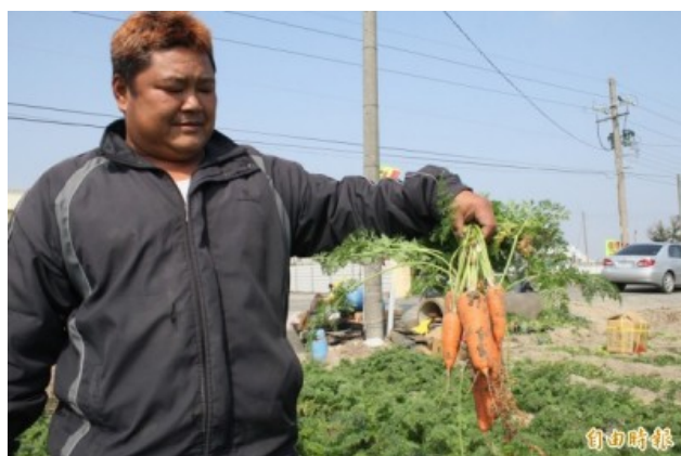
今年初的帝王寒流，造成台南地區胡蘿蔔體型縮水。

儘管胡蘿蔔被認為是較不受低溫影響的農作，但今年寒流威力異常，加上冬雨不斷，使得胡蘿蔔種植困難、體型變小，台南將軍、佳里、西港、七股等主要產區減產五成以上。根據今年二月自由時報的報導，往年一分地產量約一萬二千公斤，今年只剩五至六千公斤，有農民甚至只採收三至四千公斤。梅姬颱風過後胡蘿蔔漲至歷史天價，年初帝王寒流造成的產量銳減是主要因素。