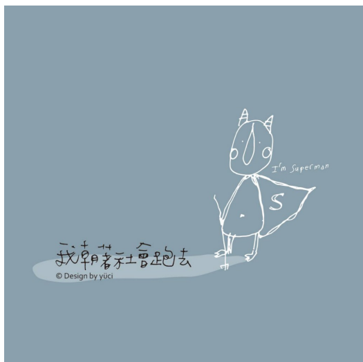
Yuci的創作色調隨著文字改變，不全是色彩繽紛的畫面。

倘若要創立公司品牌，就得加深加廣，將自身專業昇華並拓展不同領域的人脈。「可能會先工作五到十年，到各家公司學習，再出來發展自己的品牌。」為了了解公司整體的運作，所以她不會長期待在同一領域，如此一來才能更接近她的夢想。