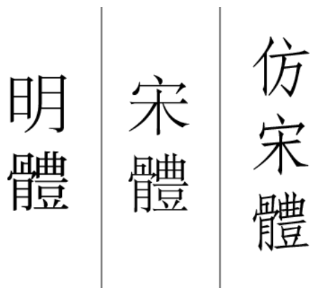
從左至右為72pt的小塚明朝Pr6N、Adobe宋體、Adobe仿宋體。

到了明朝，活字印刷盛行，字被刻於木塊、銅塊或鉛塊上，可自由移動排版、重複印刷，因此民間不再盛傳手抄書，而是以印刷書為主。此時為了刻印方便，逐漸演變出一種「豎筆粗橫筆細」的字體「明體」。滿清入關後為了避諱「明」一字，將明朝出現的字稱為「宋體」，因此明體與宋體指的其實都是明朝時期的字體，後人臨摹宋徽宗「瘦金體」而創的字體則成為今日的「仿宋體」。