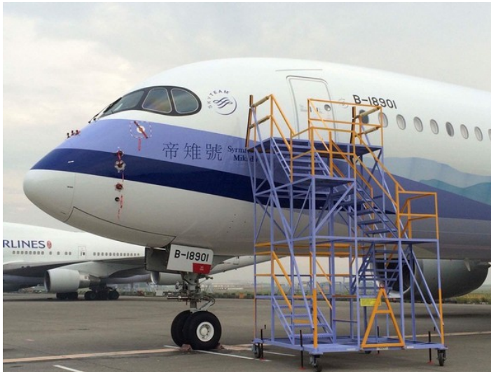
華航客機機身上「帝雉號」三字採用新細明體寫成。

2016年10月22日，華航引進的A350客機「帝雉號」機身首度曝光，照片在華航的粉絲專頁釋出後，卻得到負評如潮。原因出在機頭左側的「帝雉號」三字，竟採用「新細明體」，有網友直接抨擊「很醜」、「連小學生都知道報告不要用」。