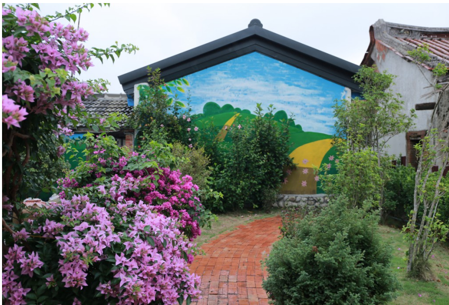
山柑社區的老舊農村，經由農村再生，正邁向一條百花齊放的新出路。

苗栗縣苑裡鎮的山柑社區，就是個典型的成功案例。從1765年至今，山柑雖然經歷過百年的洗鍊，但曾有的榮景卻早已消失殆盡，而如今藉著農村再生，山柑社區找到一條新出路。整體煥然一新，卻不失原有的歷史韻味，也成為許多老舊農村效仿的典範。