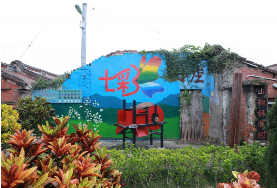
原為斑駁的磚瓦牆，被改造成具有繽紛色彩的彩繪牆。以七種顏色代表著此社區純樸的居民、肥沃的土地、乾淨的河水等，共同建立起一個美好的社區。