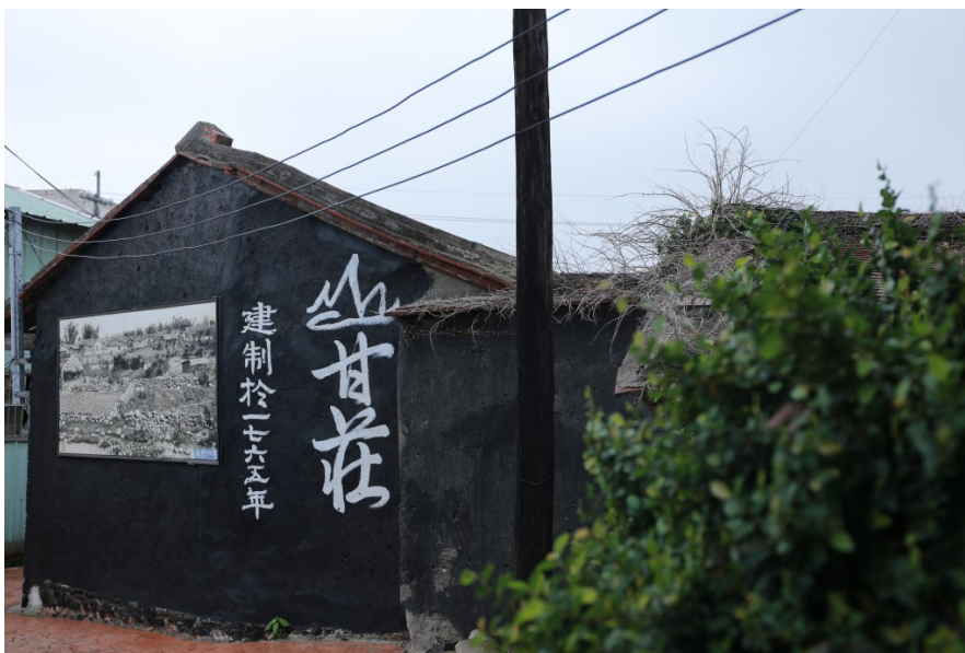
山柑莊建立於1765年，從農村轉變為今日的山柑社區。社區中的一塊休閒空地，展示著當時農村的生活景象。