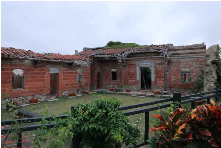
曾經王家大院鼎盛的光景，經過時間的洗鍊，如今只剩斷垣殘壁佇立於此。 百年前的瓦牆被居民保留下來，成為當地富有歷史意義的建築。