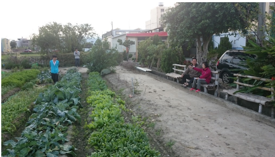
在菜園旁設置木椅，提供農民休息及居民午後休閒、培養感情的地方。