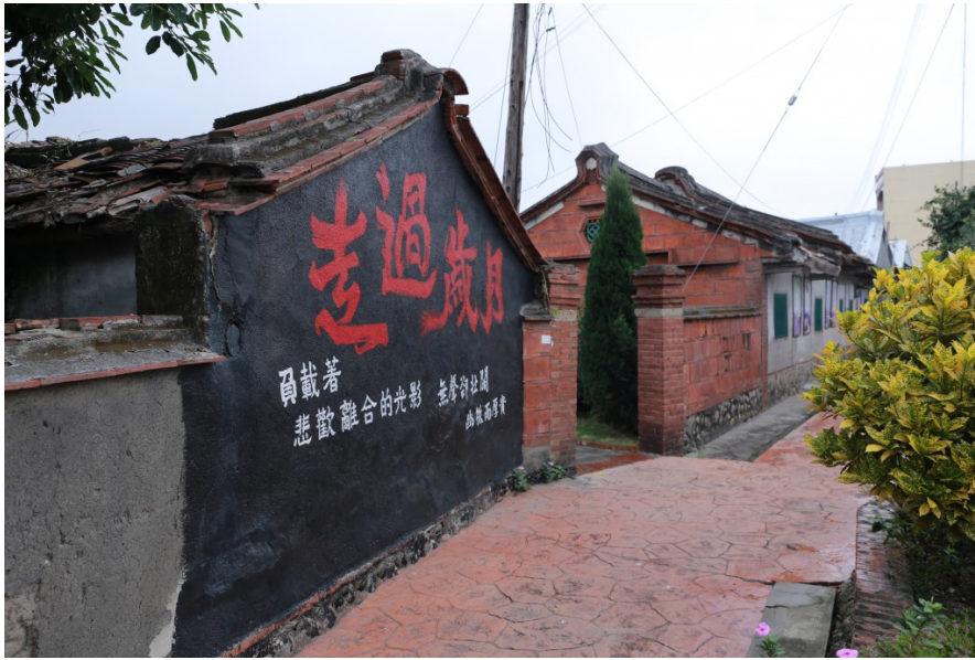
老農莊經過百年的歲月的淬鍊，乘載著無數的悲歡離合，醞釀成今日的歷史韻味。