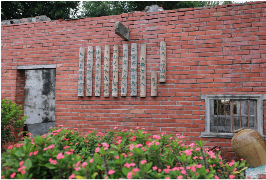
竹片與詩詞賦予老屋的外牆，嶄新的樣貌與生命，使原本被棄置的老屋，成為具有藝術感的社區造景。