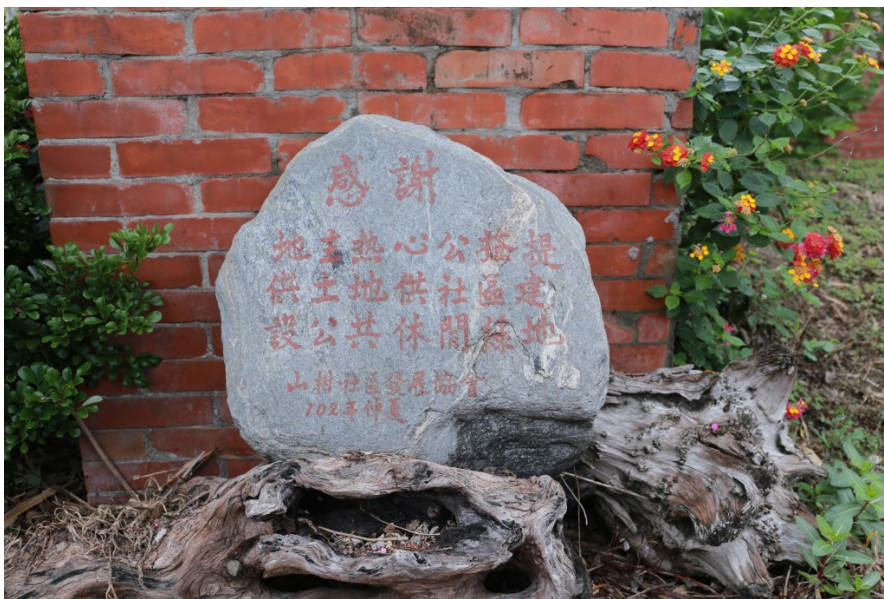
因為當地居民願意合作，使農村再生，才有今日改造後的山柑社區，供居民在此享受恬靜的時光。