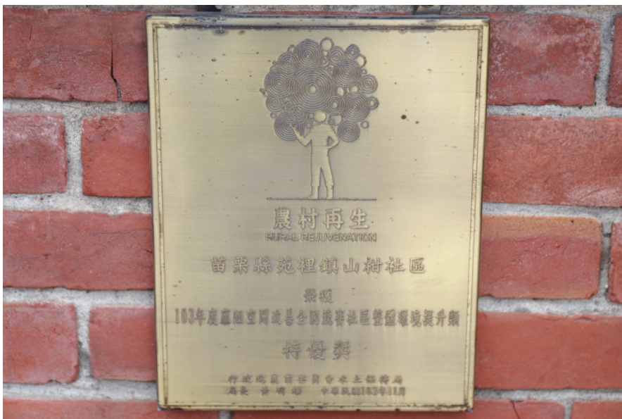
山柑社區農村再生的蛻變，得到外界肯定，也做為日後其他農村效仿的典範。