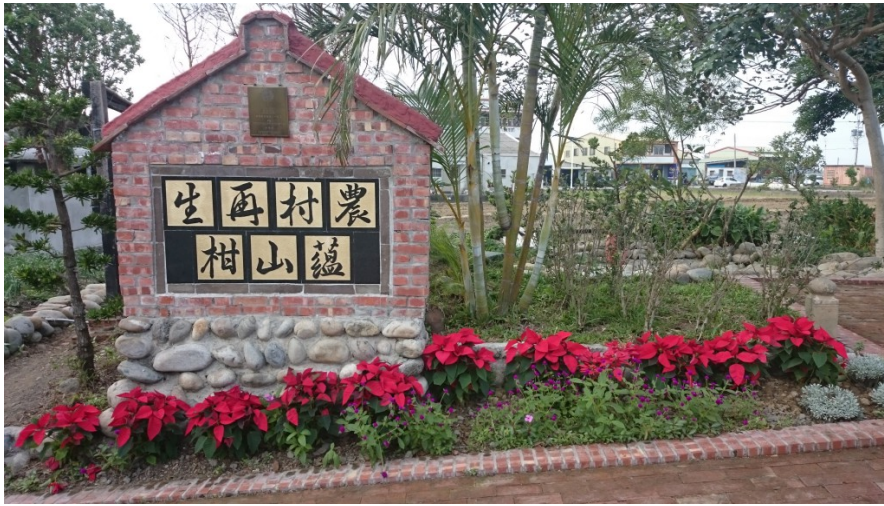
庭園中的花朵依照節日更換成應景的植物，依賴居民的巧思與用心，才能使山柑社區的生命力綿延不絕。