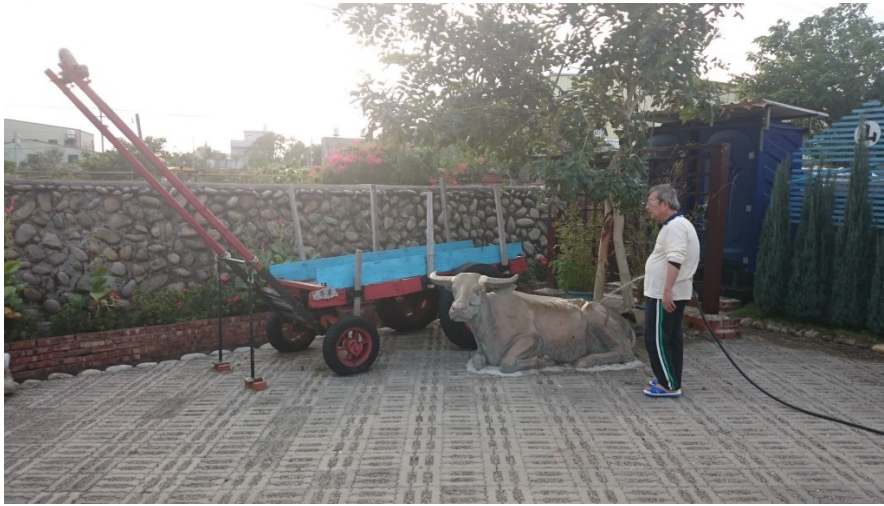
社區裡擺飾著當年農村使用的農用器具，並定期會有居民自發性的維持此地的整潔。