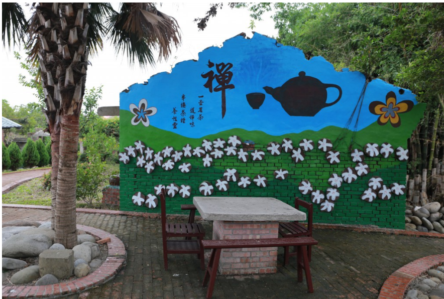
老屋的另一面瓦牆，改造為可讓居民泡茶聊天的好去處。