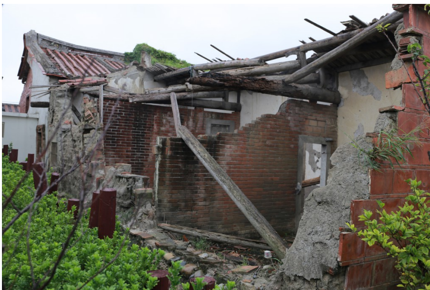
王家大院牆壁後，留存著最原始的樣貌，保留屬於這個地方的歷史感。