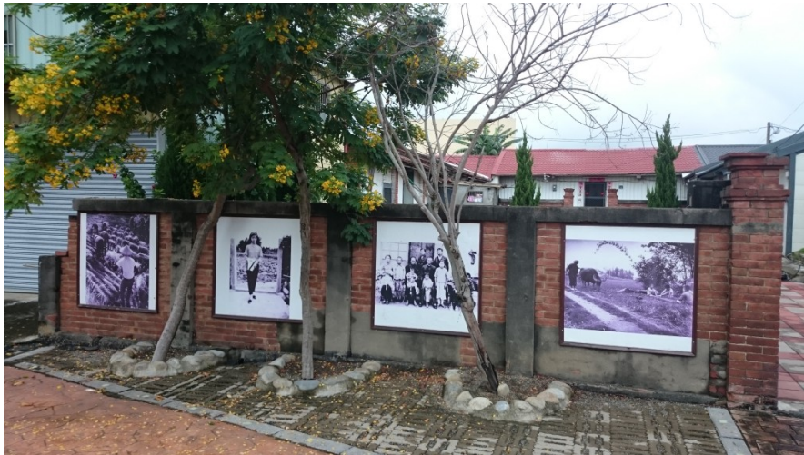
當地房屋已超過百年歷史，牆上的照片記載著當時農村的生活樣貌。