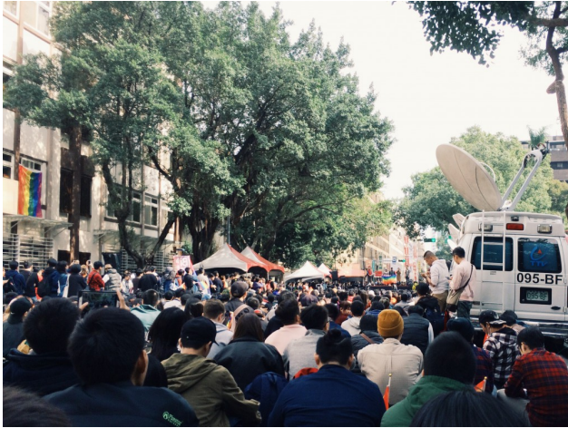
立法院召開的公聽會場外，支持婚姻平權的民眾佔據了青島東路。

婚姻平權可謂近日台灣社會的熱門關鍵字，無論是民法972的修法、另立專法的呼聲，甚至是其所衍伸攸關家庭結構、親子教育的問題，不僅充分顯現了傳統社會面對認知失衡時擦撞出的不和平，更挑戰著台灣向來引以為傲的多元樣貌與民主風氣。細究同婚議題之所以能引起高度爭議，不難發現這份價值背後牽涉到的除了對常民文化的衝擊，還有最根本的性別意識與認同問題。