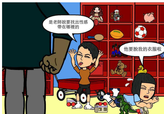
反修法單位以漫畫反映家長對於性教育進入校園的焦慮，然而資訊並不必然正確：

社會對「性」的妖魔化，並視其為不潔、羞恥的。家長們對於年幼子女探索「性」過程感到不放心，便在這個過程中將性置於負面的形象，又該怎麼讓子女正面學習呢？因此，拋去對性的成見，正是性別教育中十分重要的一環。