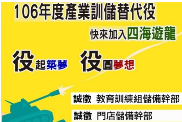
知名鍋貼店徵召產替，網路上備受爭議。

鑒於研替高度集中科技業和碩士畢的高門檻，政府於2015年起實施「產業訓儲替代役」（以下簡稱產替），開放專科學校以上畢業役男，能申請至民間產業機構從事技術工作，銜接就業並同時提供產業技術人才，並將研替與產替合稱為「研發與產業訓儲替代役」。然而根據知名求職網的同份調查，高達77%的大專役男並不買單。產替和研替的實施辦法相仿，僅有役男學歷的差別，但服役第二階段是按學歷給付役男薪資，經政府抽成後，大多數產替的薪資僅有19,000元左右。而且產替實施目的為徵召「技術人員」，多數企業認為無進用必要，產替的實施更在兩週前，引發了網路上「鍋貼役」的熱烈討論。