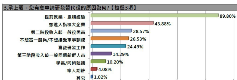
役男端調查結果。

美國教育測驗服務社(ETS)的台灣區官網也曾針對研替與義務役，做了一張圖表，單就薪資、生活型態、服役內容等物質層面比較，研替幾乎是完勝。