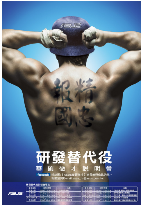
企業常舉辦研替徵才說明會。

研發替代役（以下簡稱研替）實施約八年。與義務役間的抉擇，始終困擾具研替資格的役男。高學歷氾濫，歪曲了研替的立意，使研替名實不符。近兩年兵制修改，新制度實行和役期縮短，更是對研替產生了相當程度的衝擊。