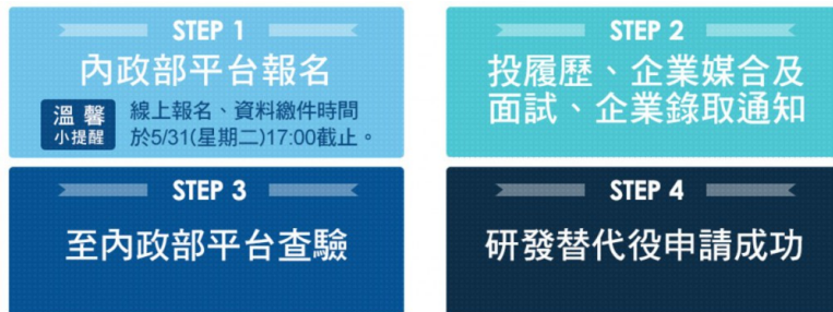
研替申請流程。

研替始於2008年，屬替代役的一支，使役男得用「服兵役」的形式，至各大企業或機關參與研發計畫，藉以提升全國產業的研發力與競爭力。研替的申請資格為碩士學歷以上的準役男。有意願者須自行至役政署官網辦理線上申請，之後投履歷到有徵召研替的公司面試。確認錄取後，至內政部平台查驗，即成功申請研替。