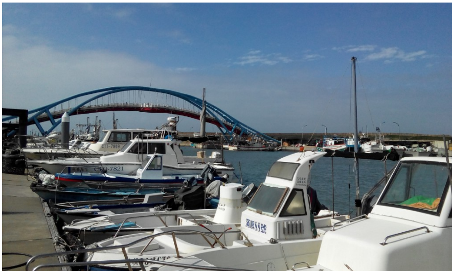
跨港拱橋正是永安漁港的地標，橫跨著進出港口的必經水道。

位於桃園新屋的永安漁港（舊名坎頭屋港），是台灣唯一以客家族群為人群主體的漁港。漁港近年來結合觀光產業，有豐富的海產美食供遊客大快朵頤，也有包船海釣與遊艇等新興服務。跨港拱橋是永安漁港的特色地標，無論從橋上、觀海涼亭、甚至是美食區的窗戶，都可以看到波光粼粼的壯麗海景，結合鄰近的綠色隧道景點，是新屋最值得一遊的休閒去處。