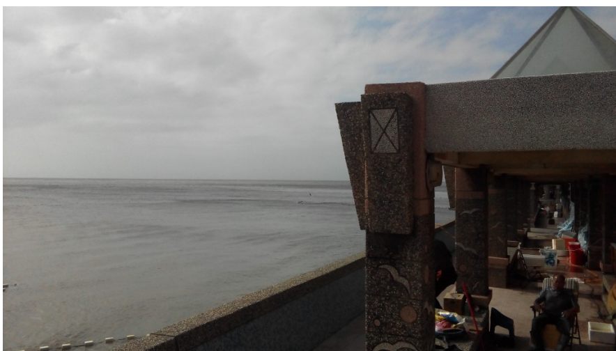
觀海涼亭外就是一望無際的大海。