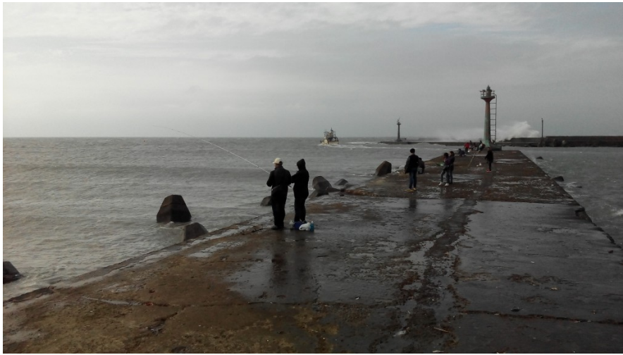
風大浪大的堤防，抵擋不了釣客們的熱情。