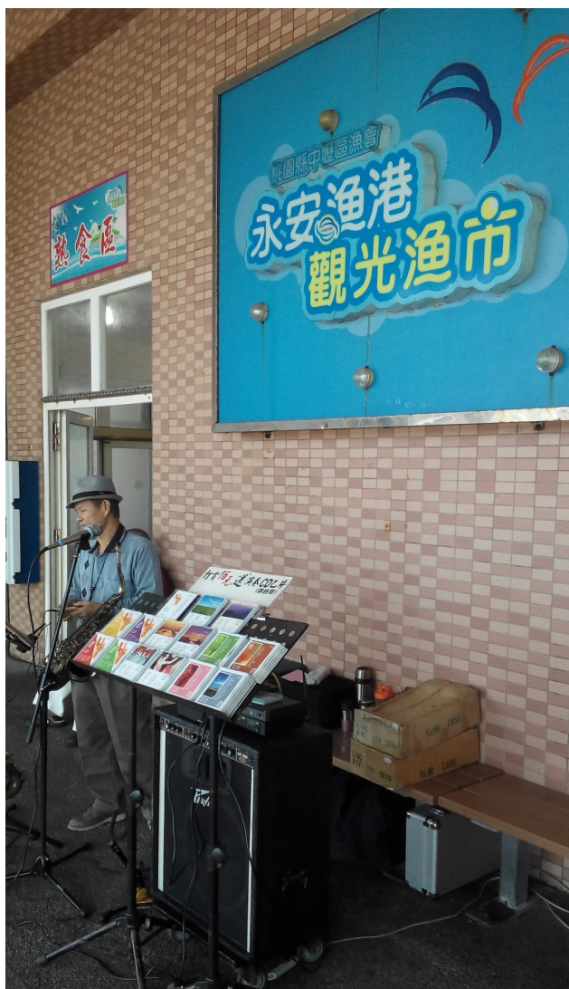
浪漫的薩克斯風音樂，在漁市入口歡迎旅客。