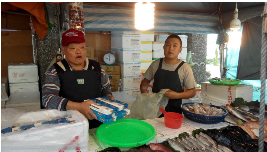
長輩與年輕一代共同在漁市打拚的身影。