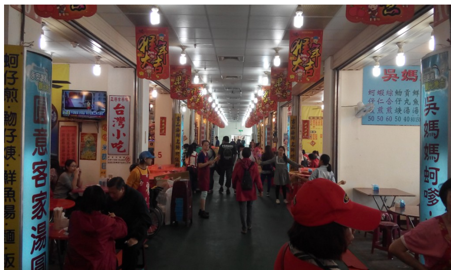
琳瑯滿目的美食區商家，熱情的店家招呼著客人。