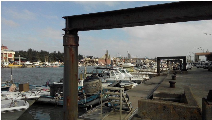
港內成排的漁船，等待著下次出海。