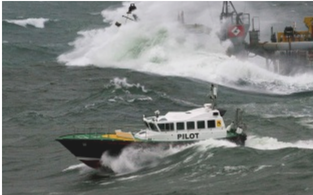
就算海浪高過船身，引水人還是不能因懼怕而忽忽職守。

少了引水人，貨物就無法順利進港，民生用品的來源也會受到影響。單一貨物的價值確實不高，但是通常大型貨船進出商港都是承載高噸位的貨物，整艘船一旦發生意外，可能造成難以挽救的損失，例如乘載化學藥品的船隻，若不幸誤觸暗礁、撞上障礙物，外漏的藥品不但會讓船公司、貨主損失慘重，海洋生態也隨之遭殃，因此引水人的存在相當重要，同時必須肩起重責大任。