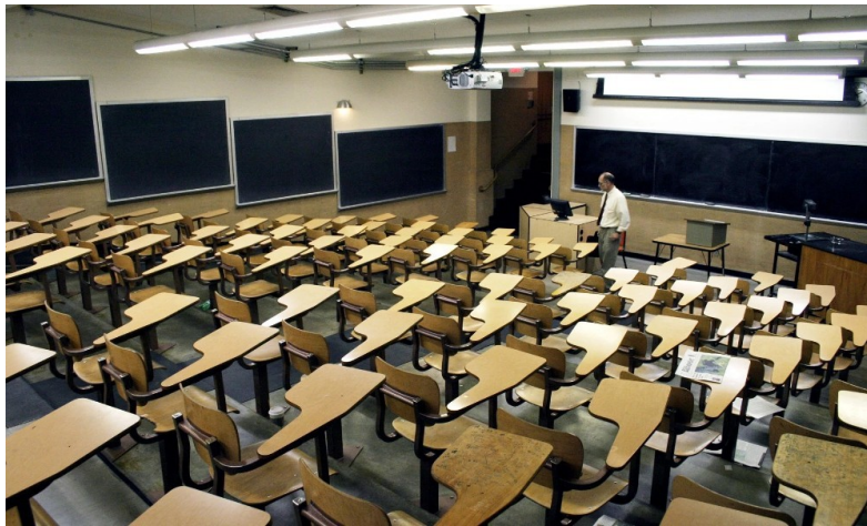
陸生若繼續減少來台，許多大學將面臨少子化、招生無力的結果。

清大招生組表示，由104學年度及105學年度的註冊和實際報到人數來看，雖學位生的部分並未顯著減少，往後的立場也仍是鼓勵陸生來校學習，更有多所國立大學設立獎學金提供辦法，挪用自身預算吸引陸生來台。官方方面，蔡英文於2016年10月24日拍板通過陸生納保的議案，黨團將著手進行《兩岸人民關係條例》第22條的草案修正（即三限六不政策），雖在內容上仍有諸多爭議，但此舉對陸生和大陸官方皆是一種善意表現，有望緩解兩岸現況。