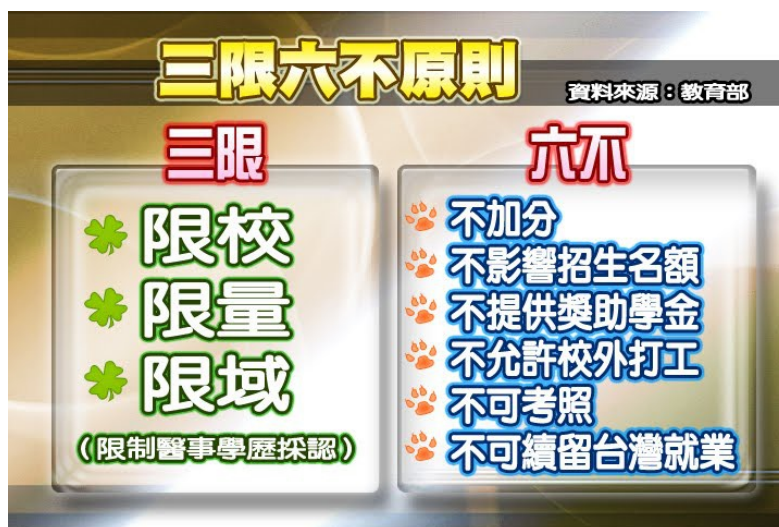
圖為三限和六不的內容，規範嚴苛。

另一方面，對於陸生來台，台灣仍設有「三限六不」，「限校」是只採認大陸認可的優良高等學校學歷，「限量」則是限制陸生來台總額，「限域」是限制領域，如中西醫、醫檢、藥學或是涉及高科及國安等等科目皆不採認，而「六不」的內容主要針對在台活動規範。種種要求皆十分為難陸生，不僅在意識形態上已先處處針對，相對於大陸對台生的規則更是嚴謹許多，造成越來越多陸生不滿及大陸官方的批評。雖然「不得在台就業」規定已經稍微鬆綁，陸生可在領域內兼任學術性質的助教、研究助理，但仍有諸多不合理的規定需要更長期的審訂和修改才能促進更多台陸交流。