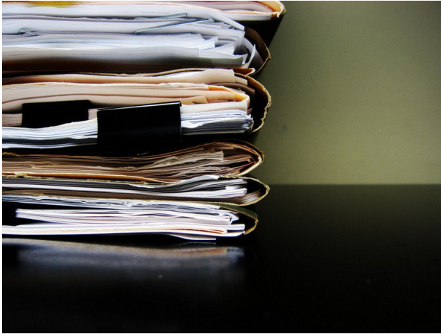
除了教學以外，偏鄉教師常身兼多個行政職位，工作十分繁重。

除了必須處理學生的問題以外，在偏鄉學校任職的老師也必須負擔沉重的行政事務，雖然偏鄉學校學生數少，但行政事務並不少於都市的學校，甚至為了幫學校爭取預算，以及教育部推動的特色學校政策，還要寫許多教學計畫書來申請經費。在都市任教的老師，不一定要兼任行政職位，學生放學後就是自己的時間，但是在偏鄉學校，由於人手不足，一個老師要當三個用，許多老師身兼數個行政職位，還有自己的導師班級要顧，即使想要致力於教學上，也常因為行政庶務繁雜而犧牲備課時間。教學成果不被看見，與都市教師相差不多的薪水，事務卻更加繁雜，鮮少有人願意自願至偏鄉服務。偏鄉學校的教師空缺，始終是校方填不滿的痛。