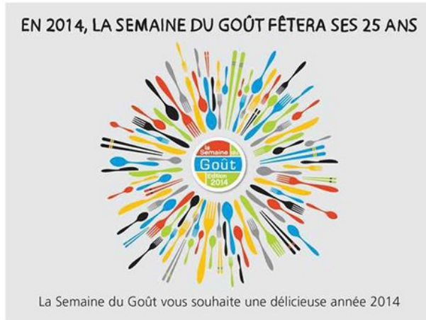
法國味覺週主題海報。

從電影教育到味覺週，法國對藝術各種面向的培養不遺餘力，他們深信優越的美感品味，對氣味、影像的敏銳度，是他們必須傳承下去的自信，也是競爭力。