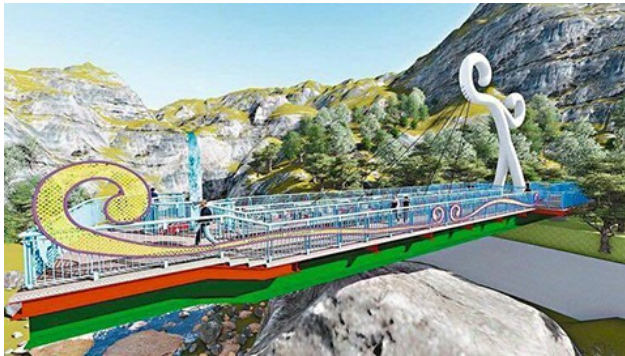
南投縣瑞龍瀑布的空中觀瀑台示意圖。

2016年暑假，南投縣政府打算花2800萬元，為其熱門景點瑞龍瀑布打造空中觀瀑平台。示意圖一釋出便負評如潮，網友連署抗議，深怕此平台完工之「醜」將難以想像。除了公共建設被批評難看，台灣還有許多公家機關的建築物受到網友質疑，政府花了大把鈔票請設計師，過程中也有審圖，為何還交不出「美」的建築，台灣的美感教育出了什麼問題？