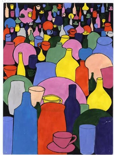
義大利孩童的作品。

在藝術文化豐富的義大利，學生從孩提時期便由父母、學校引領，頻繁造訪美術館、博物館，讓他們盡情發表評論、臨摹畫作。雖然剛開始年幼的學生不見得能看懂藝術作品，師長依然樂於鼓勵孩子靜下心觀察、體會，並試著將自己的感受描繪出來。他們對美的敏銳度來自從小到大的訓練，大量吸收美的元素，試著分析哪裡好看、為什麼好看，並且模仿那些大師級創作、世界名畫。