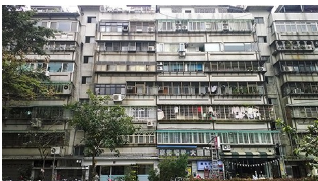
台灣隨處可見的住宅建築。

雖然美感是主觀的價值，但陳慕天切換到這張投影片時，台下的聽眾很有默契地報以掌聲與笑聲。他們可能來自各種不同領域，卻能對眼前的比較圖產生共鳴，認同大方的線條、簡潔明快的配色設計組合，似乎就是比較美。但是也有網友認為，「沒必要再花錢改市徽」，應該把錢花在更有實質幫助的建設上。許多大而無用的建築淪為蚊子館，雜亂無章的招牌以及巨型廣告和醜陋的建築「相輔相成」，讓台灣的市容普遍看起來凌亂、缺乏美感。