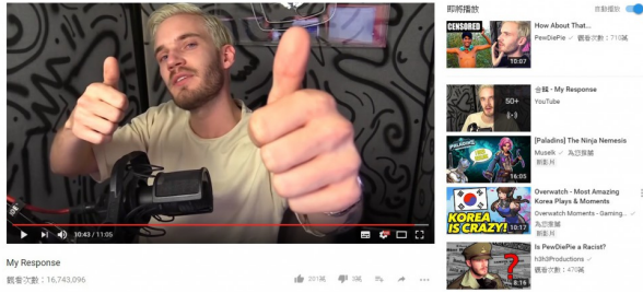
PewDiePie 近期發布影片，感謝粉絲的支持並探討媒體的現狀。