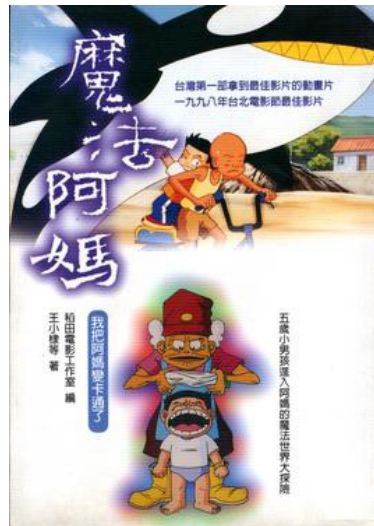
電影製作記錄集《魔法阿媽 我把阿媽變卡通了》封面。

一般廟會活動經常會看到如八家將、宋江陣等陣頭的表演，而這些源自於民間的「陣頭文化」，多由信眾自發性組成，是神明出巡的駕前隊伍，其多姿多采的表演是舊時農業社會的主要娛樂。提及陣頭，多數人不免對其抱持著負面印象，例如逞凶好鬥、幫派分子、吸毒等不良行為，然而卻是台灣最基層的藝術。