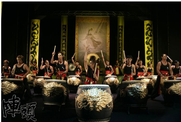
陣頭劇照。

2012年，由導演馮凱所執導的國片「陣頭」上映12天即達破億票房，故事以台灣傳統廟會活動中活躍的「陣頭文化」為題材，描述陣頭藝術在傳統與創新之間的衝突和改變。此片改編自真人真事，原型來自於台中的九天民俗技藝團，團長許振榮帶領團員將陣頭改革創新，企圖扭轉大眾對於傳統陣頭的負面形象。2012年時九天民俗技藝團甚至登上紐約林肯中心的舞台演出，將陣頭從民間廟會轉變為藝術表演，是成功帶起台灣民俗信仰成為文化藝術的代表者之一。