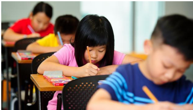
麥當勞化的教育，考試演變成追求高效率的方法。

套用在教育上面，為了能在最短時間，看見好成績（成效），只挑考試重點學習，不會考的題目直接略過，或死背會考的題目，而不去思索知識的來龍去脈。考試作為檢視學習成果的用意也因此變質。