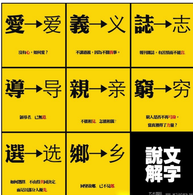
繁體字轉為簡體字的結果，令許多反對人士存疑。(圖片來源/藝術國際)

2009年中國政協委員會有幾位委員上呈了復興繁體字的提案，認為簡化過後的漢字時常去掉重要部分，令許多字失去了本來的意義，例如麵包的「麵」，簡化字將當中的「麥」去掉而成為「面」，無法再由文字本身明白此字背後的意思。更為激進的學者則希望中國能廢除簡體字改使用繁體字，他們認為簡體字的發展雜亂無章，許多字違反了傳統的六書造字法則，中國論壇網站便曾經出現「親不見(亲)，愛無心(爱)，產不生(产)，麵無麥(面)」的順口溜來批評簡化後的漢字去掉重要部分導致失去字體本身的意義，認為改用繁體字能夠順利延續傳統漢字文化。2015年中國導演馮小剛在中國政協會議呼籲恢復部分的繁體字，讓文字的內涵真正體現，並且其納入中文教育中。