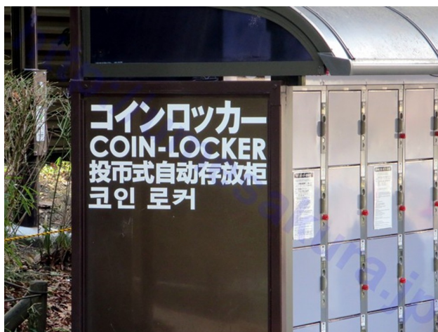
位於日本公園的置物櫃，中文即為簡體字

根據維基百科，目前有使用簡體字的國家有中國、馬來西亞、新加坡等，聯合國也將簡體中文列為官方中文字體，日本、韓國也使用漢字，但簡化程度不高。而使用繁體字的國家以台灣、香港、澳門為主。隨著中國的崛起，許多國家會將觀光景點的指示牌加上中文，然而幾乎都是簡體字，這也讓一些台灣人意識到繁體字保存的重要。話題已不再圍繞著繁簡兩者誰是正統，簡體字漸漸強勢已經是不爭的事實，相反的，繁體字只在台灣及香港澳門地區被使用，甚至有外國人認為中文字的長相便是簡體字。為了不讓繁體字逐漸被世界遺忘，許多人紛紛致力於繁體字的保存。