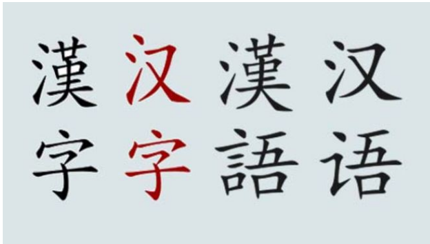
繁體字與簡體字的爭辯從未消停。

簡體字與繁體字的爭論時常被提及，世界各地針對使用繁體字還是簡體字也有不同的習性，而在當今中國逐漸晉升強國的時代，簡體字散播的速度也隨之提升。而香港、台灣、澳門等主要使用繁體字的地區，因為簡體字的擴散所帶來的衝擊也逐漸受到重視，許多人意識到保存繁體字的重要。