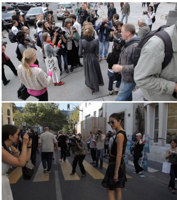
展場外的爭相拍攝與被拍攝的景況，街拍儼然失去最初捕捉瞬間的意義。

在紀錄片「拍我」（Take my picture）中，時尚編輯提姆·布蘭克斯（Tim Blanks）表示，時尚界早已漸漸注意到這個現象，許多到場時裝周、或遊蕩於場外的「花蝴蝶們」無不是想要引起人們與鏡頭的注意，秀場儼然成為交際聖地；以鏡頭捧紅不少素人的史考特甚至直街闡明「不拍想被拍的人」，以表達對街拍亂象的不滿。