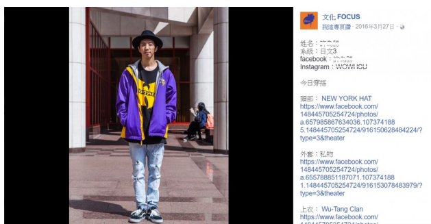
FOCUS 系列貼文如一般常規街拍形式，以人像攝影為主，

FOCUS 系列的成立宗旨簡單，呈現的品質卻絲毫不遜於業界街拍雜誌，團隊內的成員通常具備程度的品味水準，且因少了商業壓力，在營運上更能符合街拍的精神內涵，只求將值得被看見的品味上呈，以分享為旨打通校園內的穿搭美學，並提升整體美感教育。