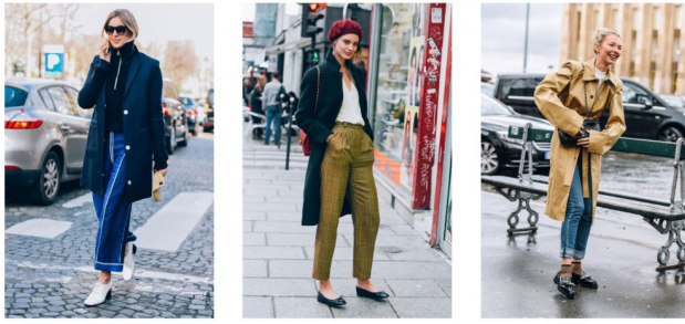
街拍的角色通常明確，畫面則可為不經意捕捉或刻意的表現。

姑且不論攝影技術，對街拍攝影師而言，最關鍵的還是其判斷品味的能力，畢竟對穿搭有所講究的素人固然多，卻並非每一份個人特色都有足夠的深度，因此，攝影師對拍攝對象的掌握不僅決定了其作品樣貌，也決定了他的「信徒」。