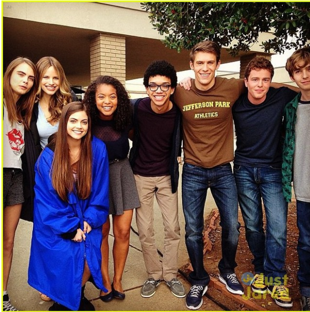
女主角(左一)與眾演員。