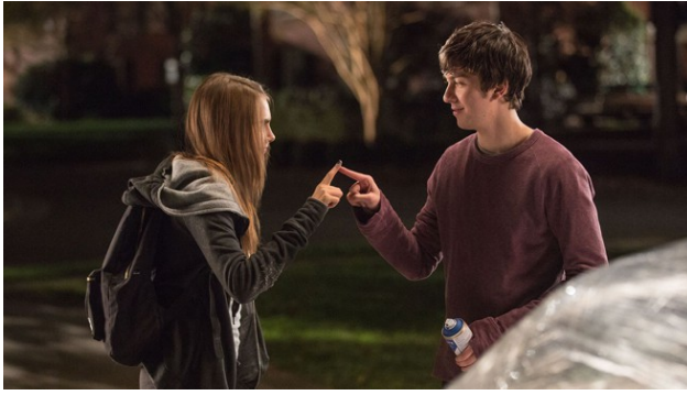
瑪歌鼓勵昆汀跨出舒適圈。