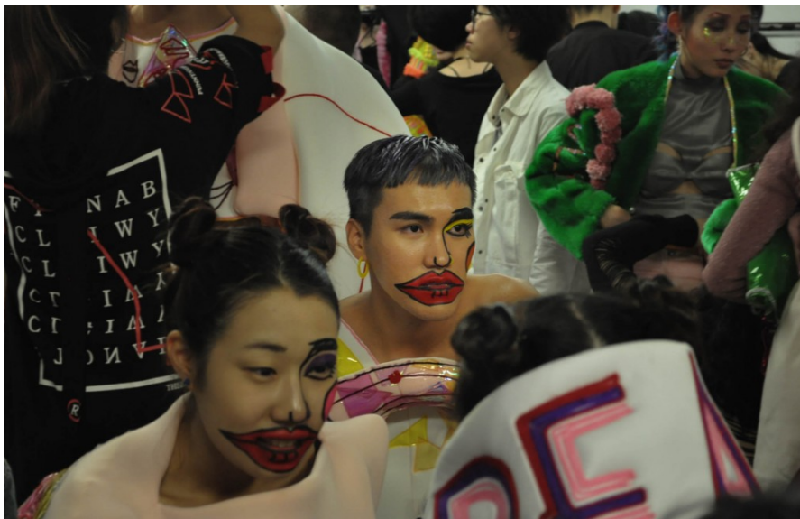
模特兒臉上帶著塗鴉式的誇張濃妝在後台等待著上場。