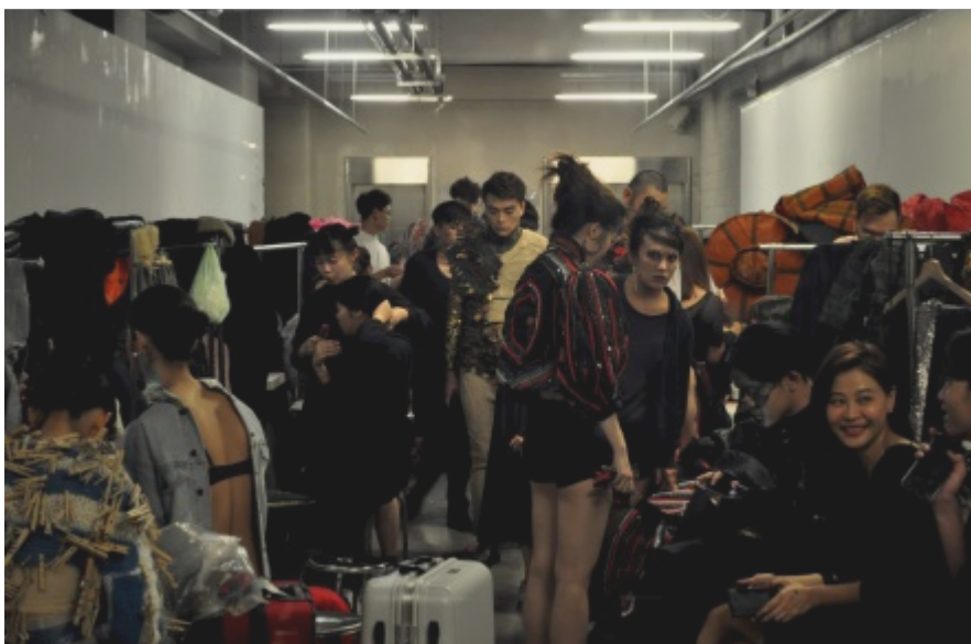
人員來回流動、衣架及衣飾遍布通道兩側，擁擠的空間顯示後台作業的忙碌。