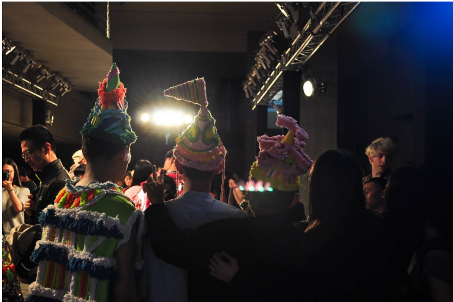
光輝熠熠、人群鼓動，一年一度的實踐服裝周在熱烈的合影下完結了。