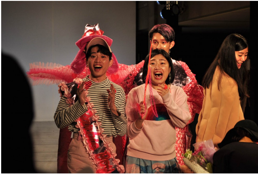
設計師在賽後的謝幕環節登台，因見到前來支持、觀賽的親友而面露欣喜。