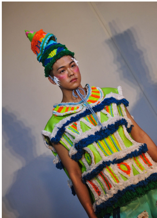
「生日皇帝大」以大膽活潑的配色與俏皮的造型設計帶出強烈的慶生氣氛。