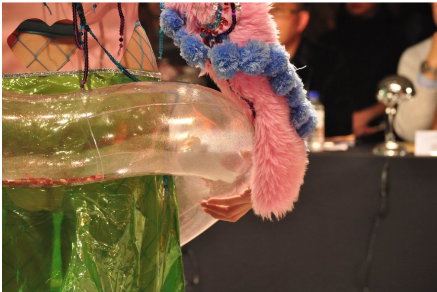
塑料、毛料等不同材質的搭配雖然違和，卻因選色、反光等物理特性凸顯了作品的特殊性。