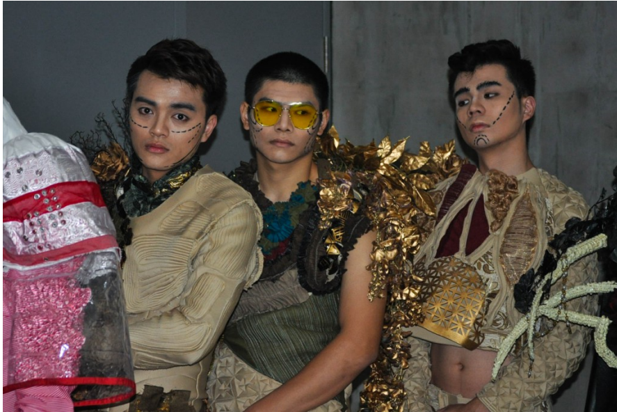
同系列的作品在臉部妝扮、服裝色調與材質上多半具一致性，並符合主題。