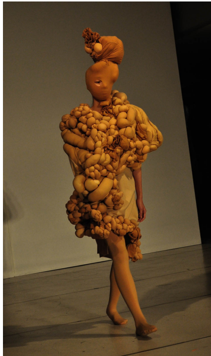
「當你的溫柔是暴力的顏色」以看似病變的畸形態， 反映外界對一個人單向壓迫而導致的自我扭曲。