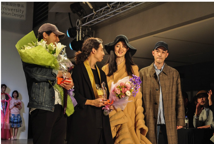
比賽結束後，受獎設計師領著其作品在伸展台上接受獻花。