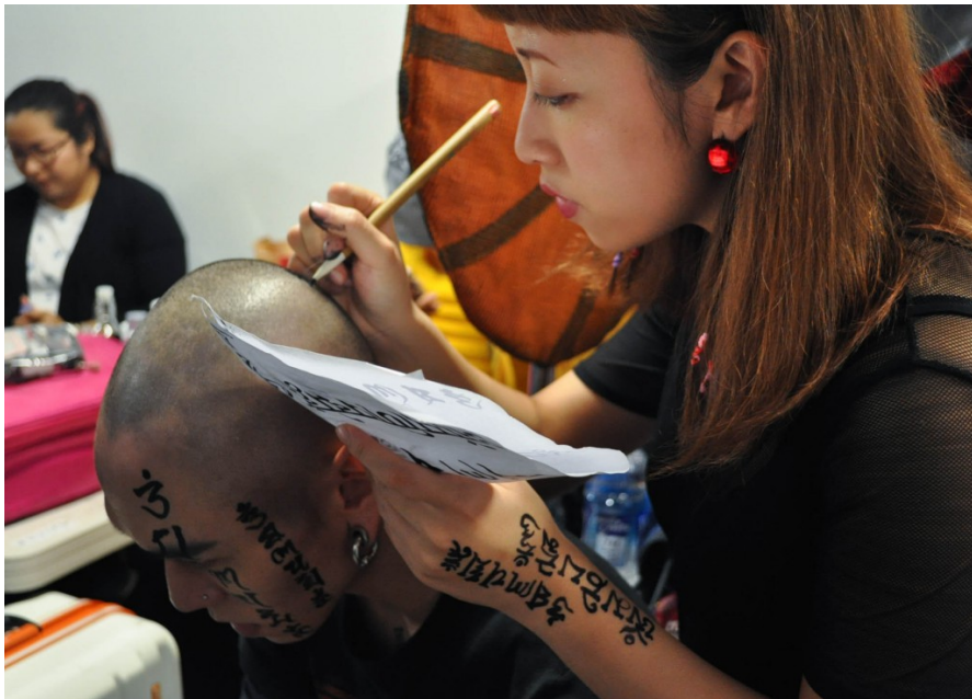
以異國經文為靈感發想的設計師在模特兒頭上試筆。