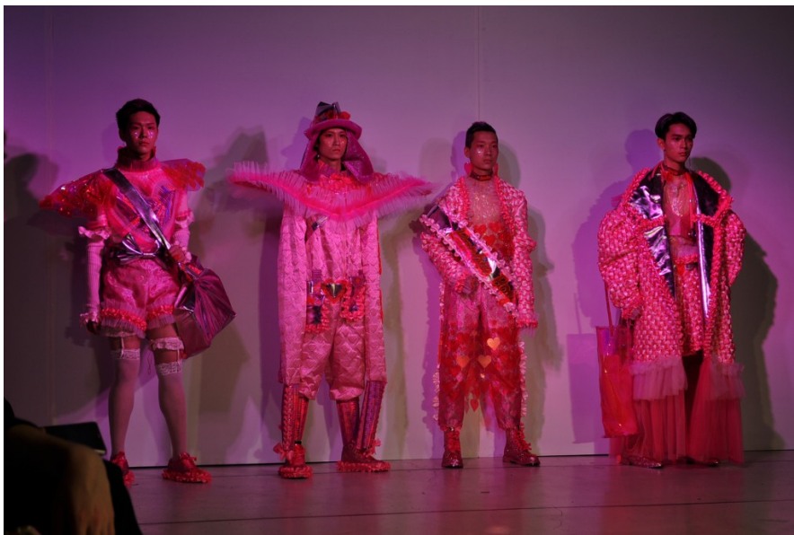
適當地運用場燈能產生與作品概念吻合的光影反應，在呈現上能更貼近主題。