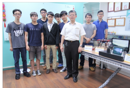
郭峻因教授(前)與團隊

今年，郭峻因教授帶領的交大團隊自行組裝一架六軸無人飛行器，方便在室內空間模擬車輛行進時偵測鏡頭的移動。