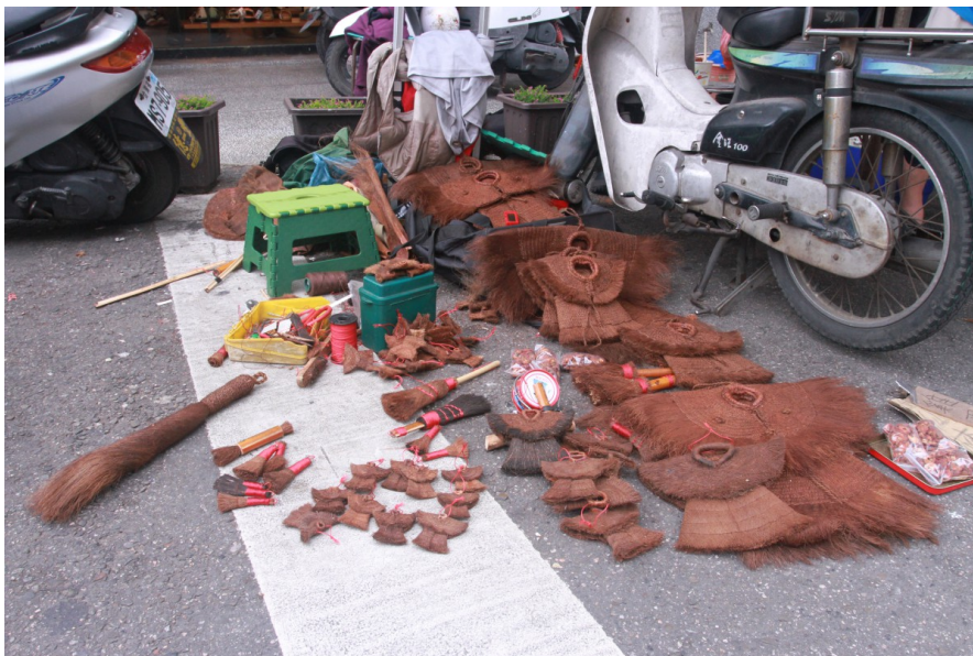
近幾年市場狀況不好而輾轉來到大甲區，因不方便開貨車前來，所以販售的並非體積較大的成人蓑衣。