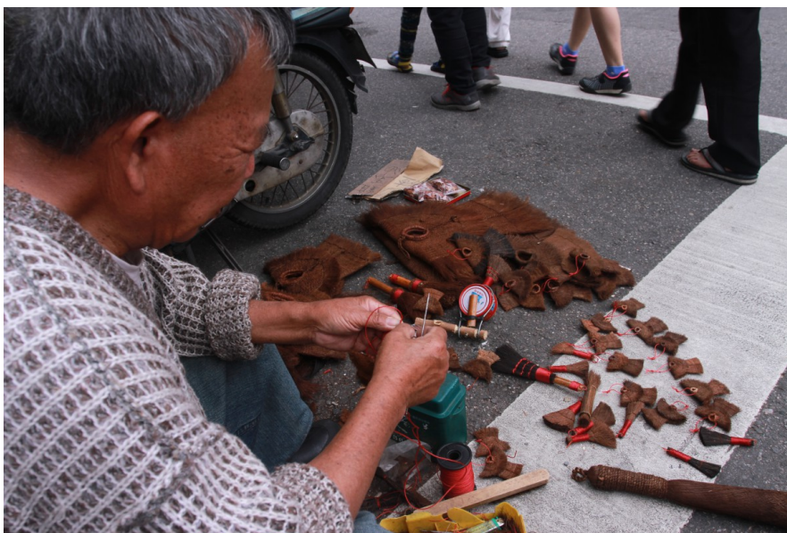
師傅平日就坐在鎮瀾宮對街的路邊擺地攤，每日從桃園市楊梅區坐火車前來販售蓑衣。