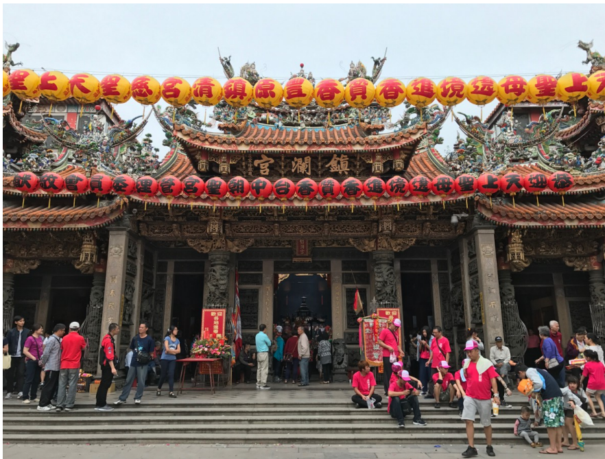
臺中市大甲區的鎮瀾宮聲名遠播，此處有一位臺灣為數不多的蓑衣師傅。

蓑衣又名「棕蓑」，是農業時代的雨衣，根據教育部臺灣閩南語常用詞辭典稱作「tsang-sui」。1970年代臺灣處於出口導向時期，逐漸從農業社會轉為工業社會，紡織與塑膠等製品迅速成長；以前一般農家必備的蓑衣，隨著時代進步已被塑膠雨衣所取代，而蓑衣具有的「避邪」意義現今則多作為裝飾品之用。藉由此次造訪臺中市大甲區的蓑衣師傅，來探究過往家家戶戶的時代記憶。