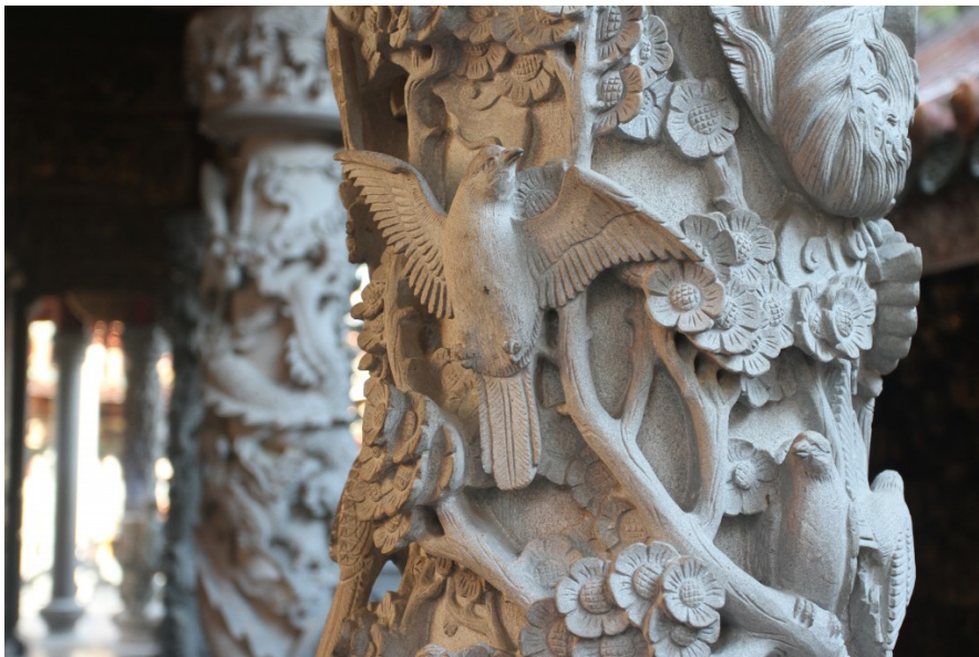
圓雕石柱呈現栩栩如生的百鳥雕刻。