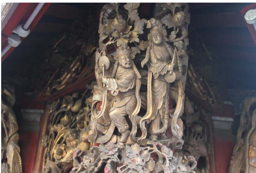
廟內木雕精細繁複，皆選用檜木和樟木，每個雕品皆採一木雕成，並貼上金箔以防蟲蛀。