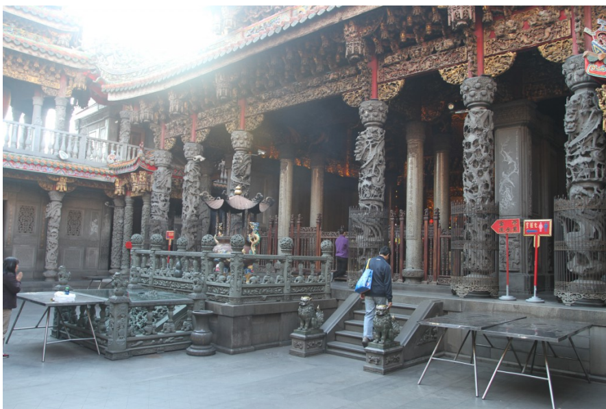
正殿前的三對透雕柱被譽為祖師廟的鎮廟之寶。