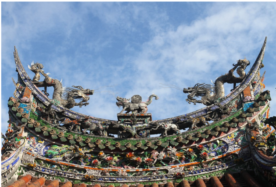
祖師廟的屋頂多採剪粘裝飾，此為廟宇左右屋脊的「雙龍護八卦」。