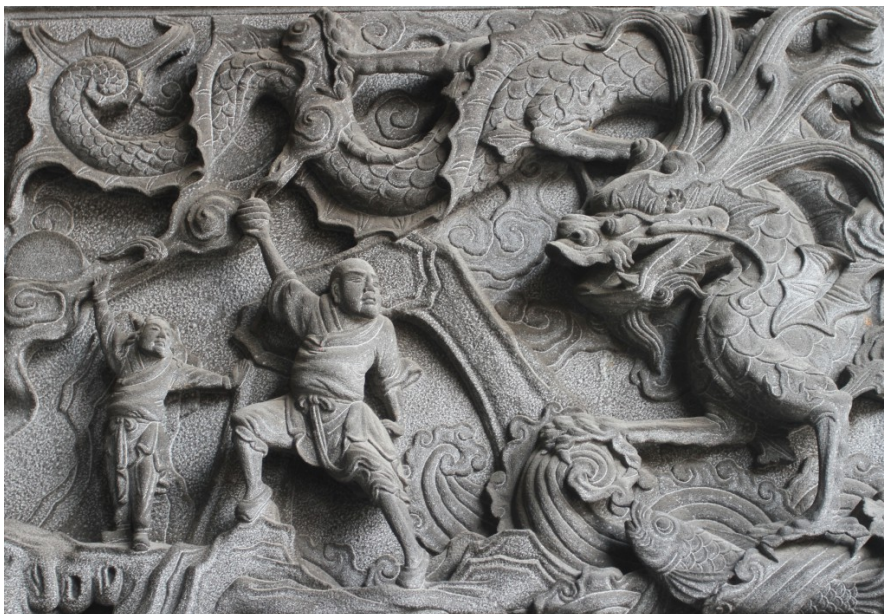
寺廟東側門雕工精細的「東龍」浮雕。