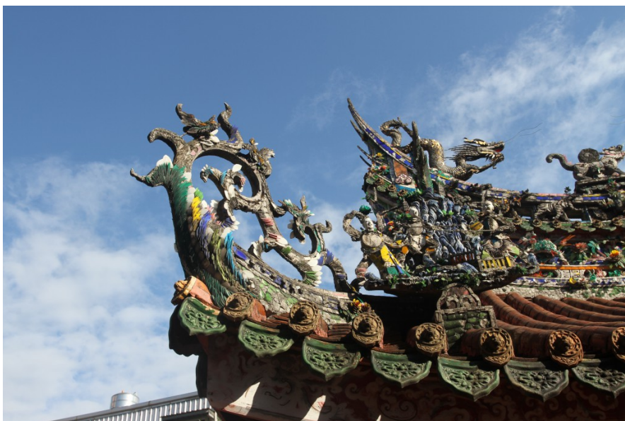
台灣傳統廟宇常使用「剪粘」藝術裝飾屋脊。剪粘藝術又被稱作「立體的馬賽克」，常用於人物造型。