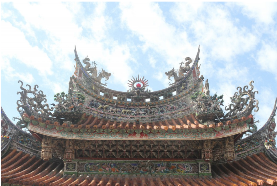
祖師廟採大脊上再加脊的「西施脊」作法以增加華麗效果。

三峽祖師廟的建築風格與台灣傳統廟宇不同，全廟的地面、廊柱、牆壁皆以石材砌築，環顧廟內皆能看見繁美生動的石雕；而在雀替、鸞拱、上檻等處則有精彩絕倫的木雕，構成這座以石為基，以木為頂的清水祖師廟。廟內每件雕刻皆引經據典，體現宗教不只是參拜，也具有文化、教育、藝術、觀光的多重功能。