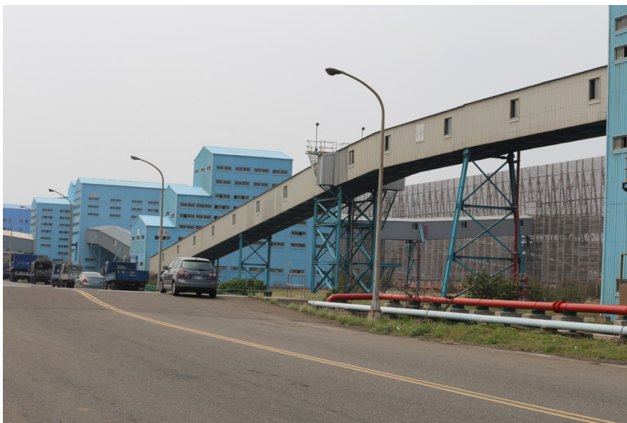
輸煤軌道綿延至少50公里，途中經過輸煤轉運站後（藍色建築），將煤運送至儲煤場。