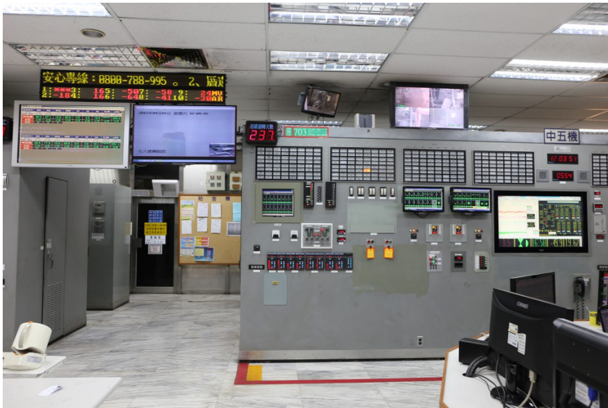
發電廠廠房隨時監控輸煤的總體情況，有狀況立即處理。