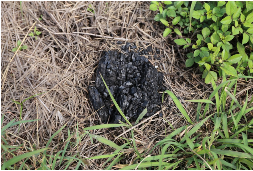
草地沿途會發現掉落的煤礦。