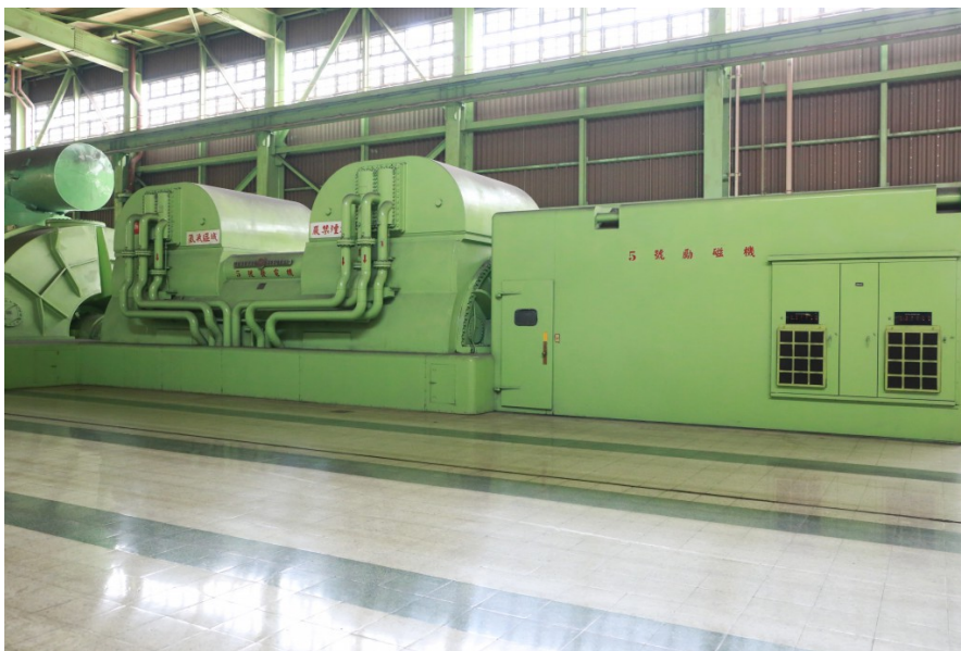
將煤送至發電廠內的鍋爐燃燒發電。