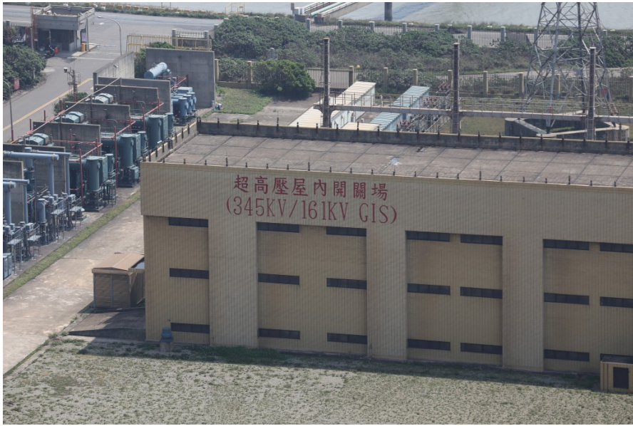
燃燒後產生的電力藉由發電機發送至各配電所。