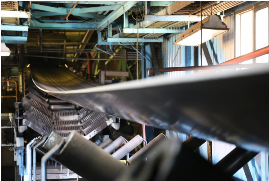
靜止的輸煤皮帶。因輸煤過程中高度污染，除了特殊狀況外，輸煤皮帶在運行時禁止靠近。