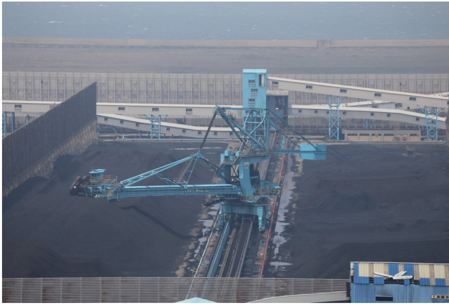
在高污染儲煤廠內，大部份以機械手臂取代人工運作。