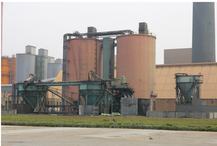
灰倉可堆放燒後的煤渣，並將廢棄物做妥善回收。