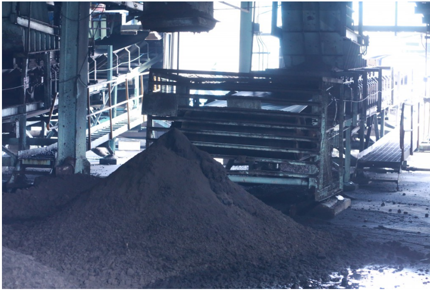
輸煤轉運站可排除瑕疵煤，並將其餘運送至儲煤場。