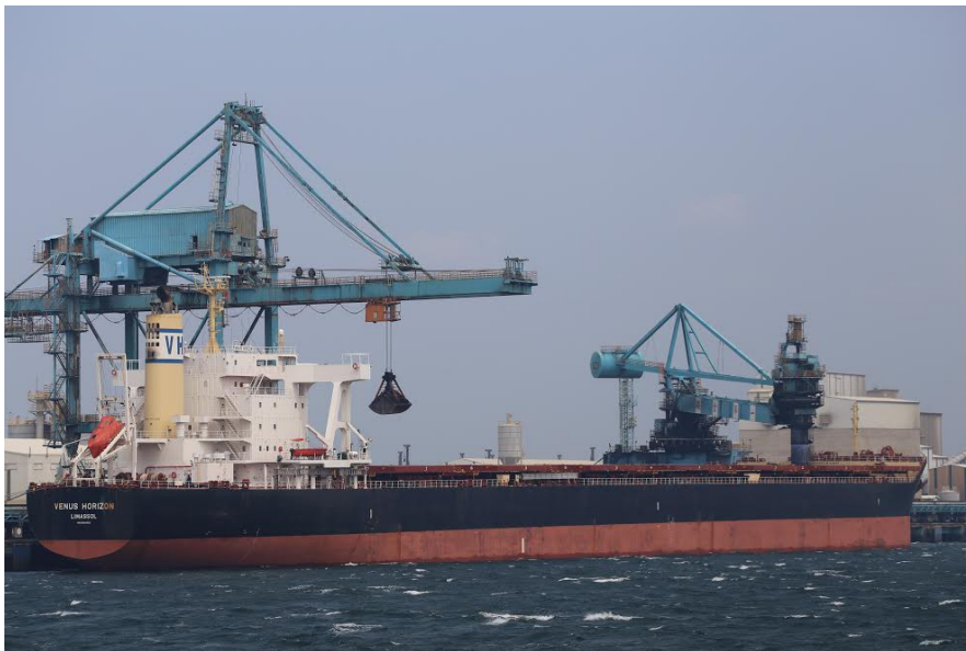
火力發電廠的煤礦多為國外進口，經由海運運送後，直接在港口由抓煤機卸煤。

煤礦基本都儲存在儲煤場，需發電時則靠機械手臂將煤運送至鍋爐燃燒，並在燃燒後引進海水將鍋爐降溫。燃燒後產生的廢棄物收集至灰倉等待回收，而發出的電力則透過大型發電機送入各機組，再由各機組送至各發電所等待配送。