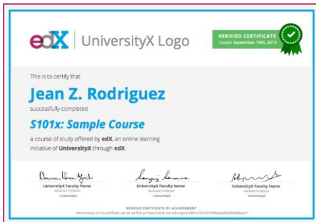
於磨課平台edX修課結束後獲得的證書範本。

拆開看每個字的意涵，Massive代表課堂不再只有幾十個人，而能達到上萬人同時上課的規模。Open則是秉持開放的理念，將高額の課程公開給需要的人使用。Online Course所有教學影片、課堂作業與評量都在網路上進行。為了營造大學生修課的情境，課程有註冊、結束時間，每周也有相應的授課進度，修課生之間的互動則設置討論區填補。課程結束後，若修課生通過考試與作業，能付費獲得該機構頒發的證書。