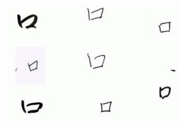
不同的「口」字，背後隱藏的性格趨向也不一樣。

個人簽名在筆跡分析中也自有一套體系。美國總統川普的簽名就像心電圖一般，是非常少見且具有特色的簽名方式，筆跡分析師便針對他的簽名，分析川普是個充滿野心且難以妥協的角色。不過簽名隱藏著本人想帶給大眾的印象，屬於有意圖的字跡，因此分析一個人也不能單靠簽名就做出評斷。