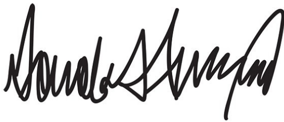
美國總統川普的簽名。

個人簽名在筆跡分析中也自有一套體系。美國總統川普的簽名就像心電圖一般，是非常少見且具有特色的簽名方式，筆跡分析師便針對他的簽名，分析川普是個充滿野心且難以妥協的角色。不過簽名隱藏著本人想帶給大眾的印象，屬於有意圖的字跡，因此分析一個人也不能單靠簽名就做出評斷。