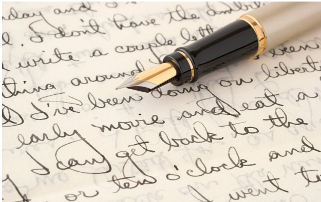
每個人的字跡不同，與個人習慣、個性等有關係。

近年來手寫風潮漸盛，網路上出現了各式各樣教學寫字的影片，實體書店暢銷榜中也能看見寫字教學書籍的身影，受到手機發展的影響，寫字機會看似越來越少，卻同時引起了更多人對於手寫的重視，然而看著自己筆下的字跡，即便想要模仿地跟別人一模一樣，在細節部分仍會有差別，而這個獨一無二的差別，也造就了一個特殊的專業—筆跡分析。