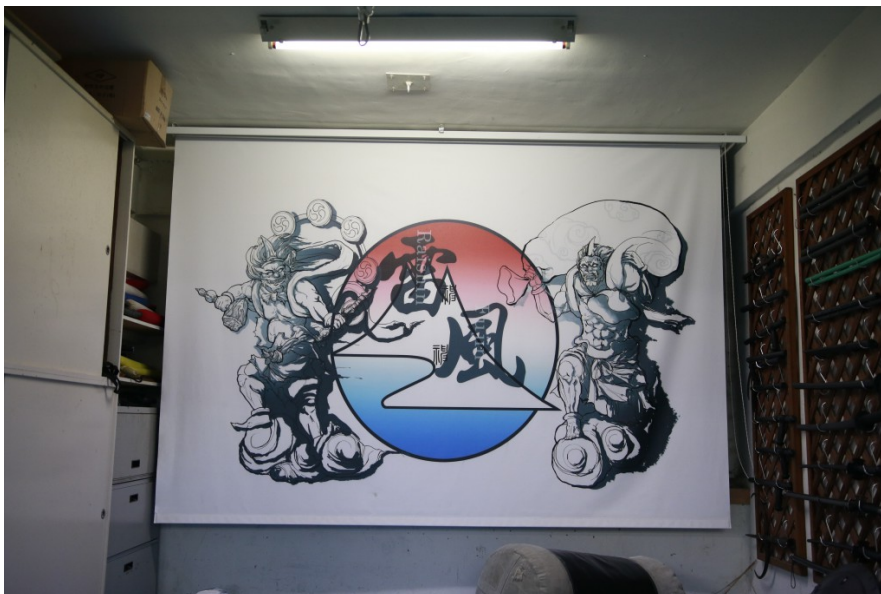
雷風旗幟背後裝載的武術思想，可看出巴西柔術與日本上古武術在發展上概念相承的痕跡。