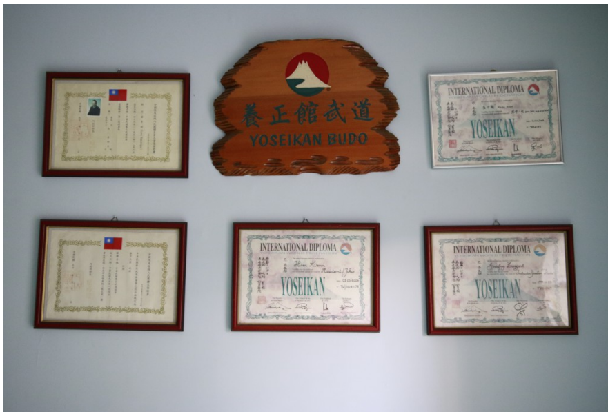
道館懸掛的養正館武道 (Yoseikan Budo)，為歷史悠久的一門日本武術概念，也是後來巴西柔術、日本綜合格鬥、與法式搏擊的起源。

巴西柔術的技巧與策略著重自衛與實戰應用，尤其適合在街頭格鬥中，透過近距離接觸當下移動身體取得控制姿勢，便能輕易將對手摔下地板，在進行攻擊手段。此種依據科學原理的搏鬥技巧使身材矮小者也可以成功制服襲擊者，在美國、巴西等西方國家廣受歡迎，在去掉具危險性的動作後，發展為一項適合全年齡學習的競技運動，同時本身也是日本綜合格鬥技的源流。