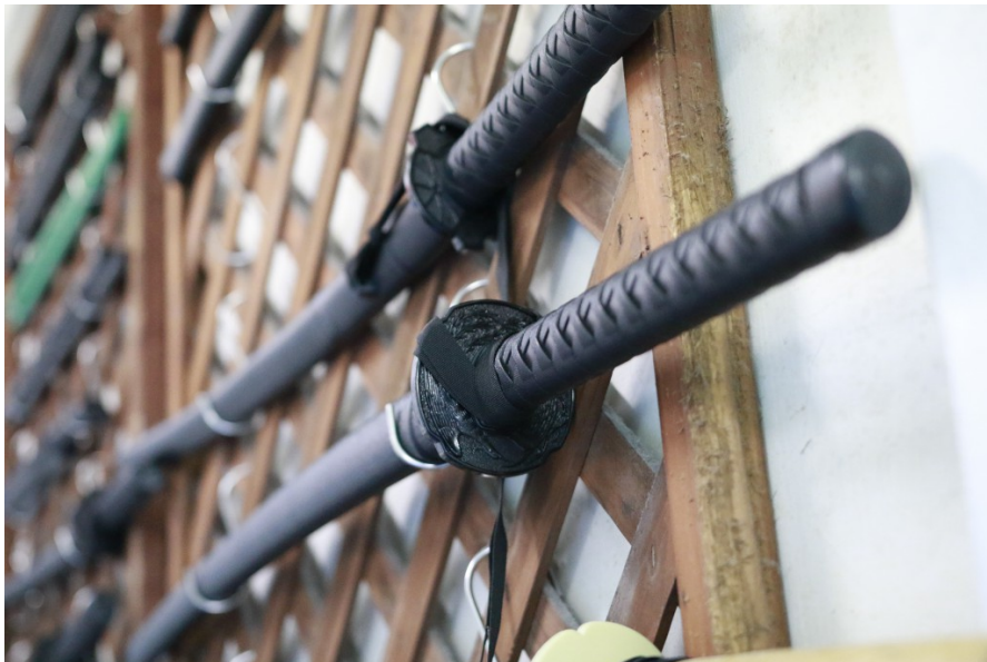
館內配有日本傳統兵器，佐證巴西柔術為中西合併下的產物。